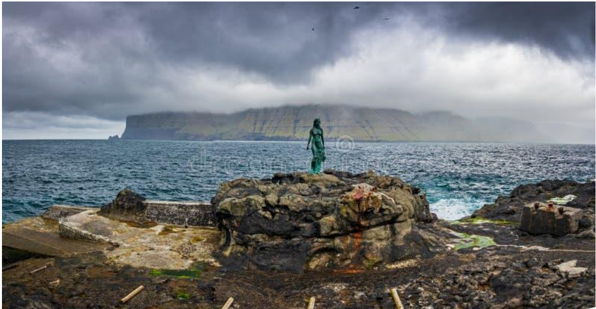
Mynd 5: Ímóti eystri

er ein sera góð ætt í Mikladali. Kunoyggin lívir, bæði fyri vind og avfalli. Hann sleppur hvørki suðureftir ella norðureftir.