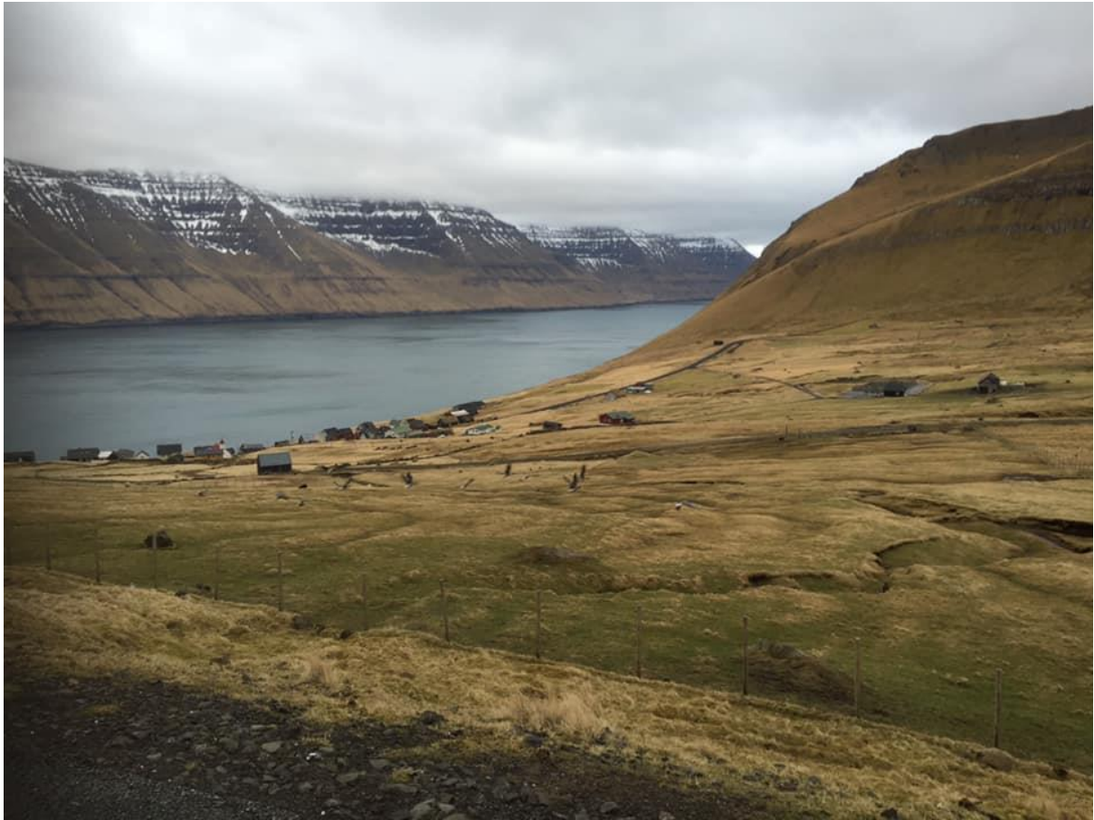
Mynd 6: Ímóti landsynningi

Vindurinn er javnur í bygdinni, og það heyrir ekki nógv til hann heimi í bygdinni, tá ið það er illveður. Úti á Magnusmørk heyrir eitt sindur.