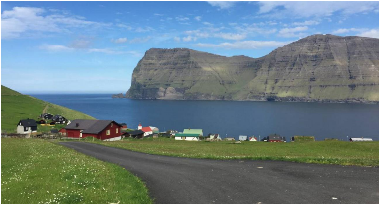
Mynd 4: Ímóti landnyrðingi eystri

Ættin líkist landnyrðingi, men sleppur ikki líka langt heim. Hann sleppur illa nokk heim til Mikladals.