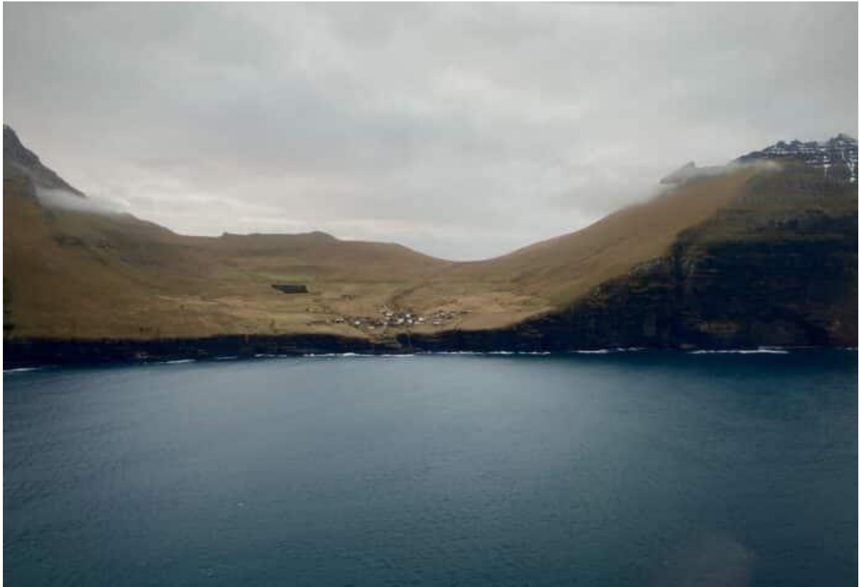
Figure 9 Ímóti útsynningi vestri