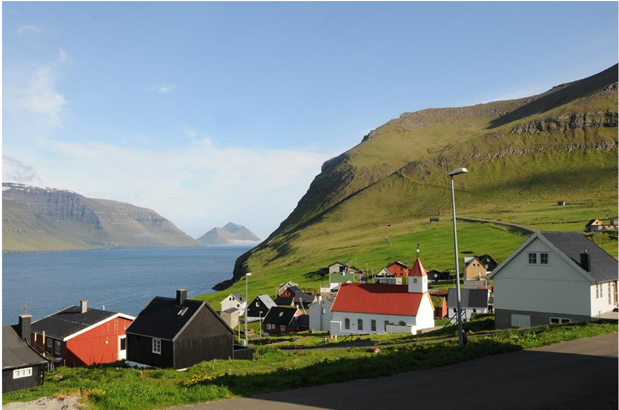
Mynd 7: Ímóti landsynningi suðuri.