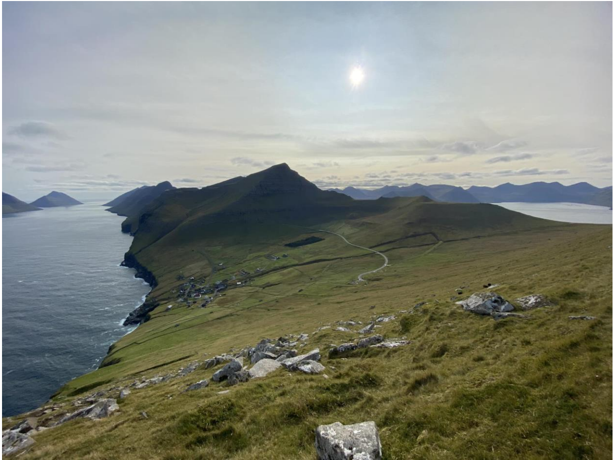
Mynd 8: Ímóti suðuri

Á suðuri er javnur vindur, og vindferðin er minni enn hon er kring landið. Tað er ongantíð nógur vindur á suðurætt, hóast nógvar glaður eru á fjørðinum, tá ið tað er illveður.