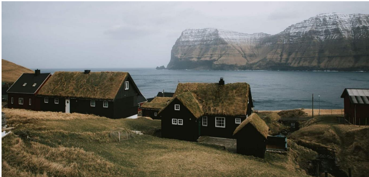
Mynd 3: Ímóti landnyrðingi

Landnyrðingur kemur undan Heystmúlanum og inn ímóti bygdini. Ættin strekkir heim á Bust – sum er ímillum Ritudal og Villingardal.