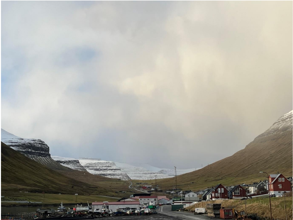
Mynd 5: Ímóti útnyrðingi

Útnyrðingur er tann besta av høgættunum í Norðragøtu. Vindurin er javnur, og vindferðin er ikki meira, enn hon er kring landið.