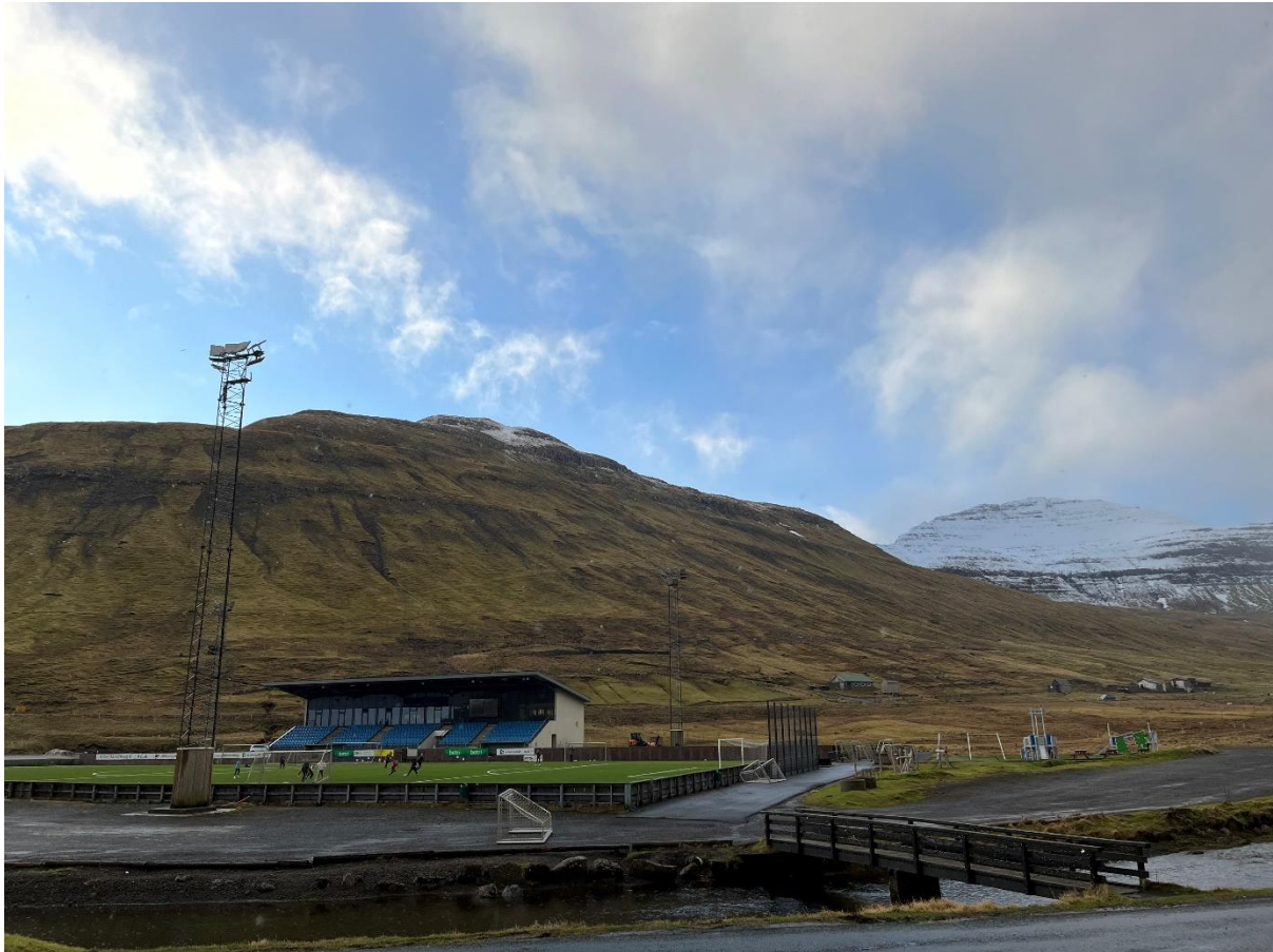
Mynd 3: Ímóti útsynningi.

Útsynningur er ójavnur við hvirlum, tá ið tað er nakað av vindi. Í ringum veðri fyllist bátahylurin, og stormurin fer niðan í gomlu bygdina.