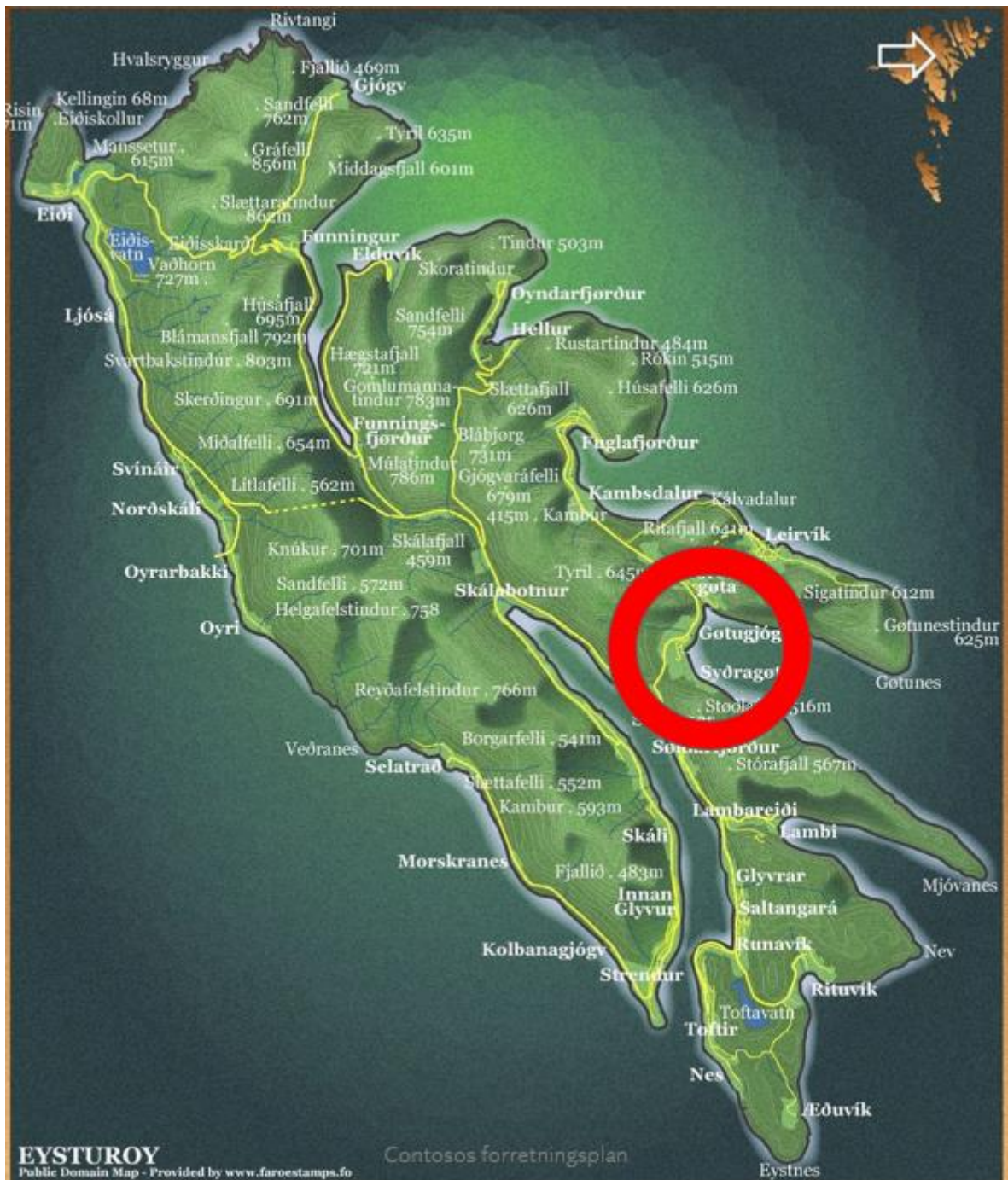
Mynd 1: Kort av Eysturoy. Norðragøta sæst í reyða kringinum