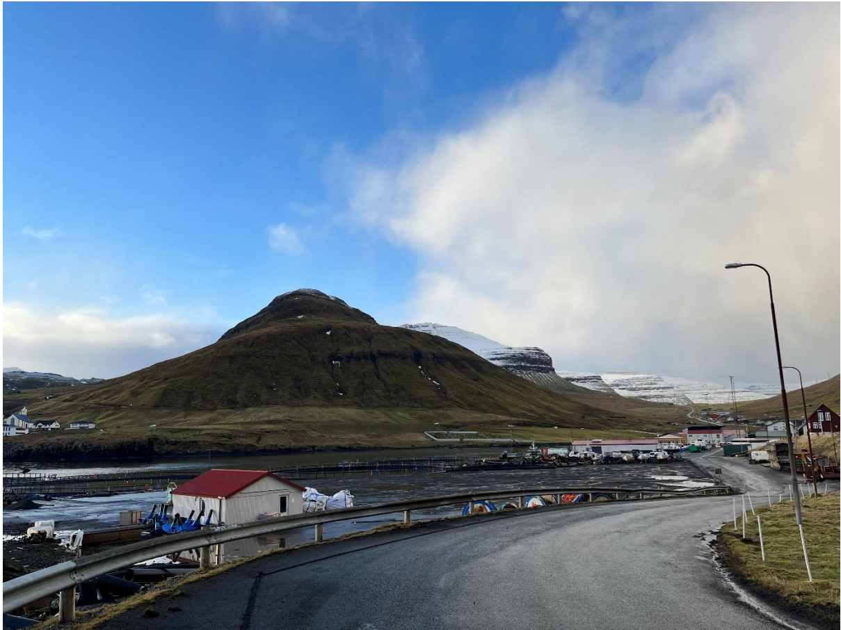
Mynd 4: Ímóti vestri

Tá ið ættin er vestan, er vindurinn javnur heimi í bygdini, tó at tað hoyrist nógv fjalladun.