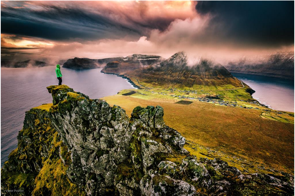
Mynd 5: Av Oyggjaskoratindi eystan fyri Villingardalsfjall og suðureftir.

Tá ið sólin kom í ættina, og tað ikki fór at regna, so bleiv ikki regn tann dagin – hetta er galdandi fyri ættirnar úr suðri til útsynning.