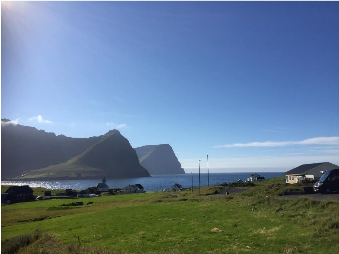
Mynd 7: Á eiðinum ímóti vestri. Myndaánari undirritaði

Vindurin á vestri er javnur. Vindferðin er so at siga altíð nakað væl størri, enn sagt hevur verið fyri landið. Miðalvindurin kann viðhvørt næstan faldast við tvey.