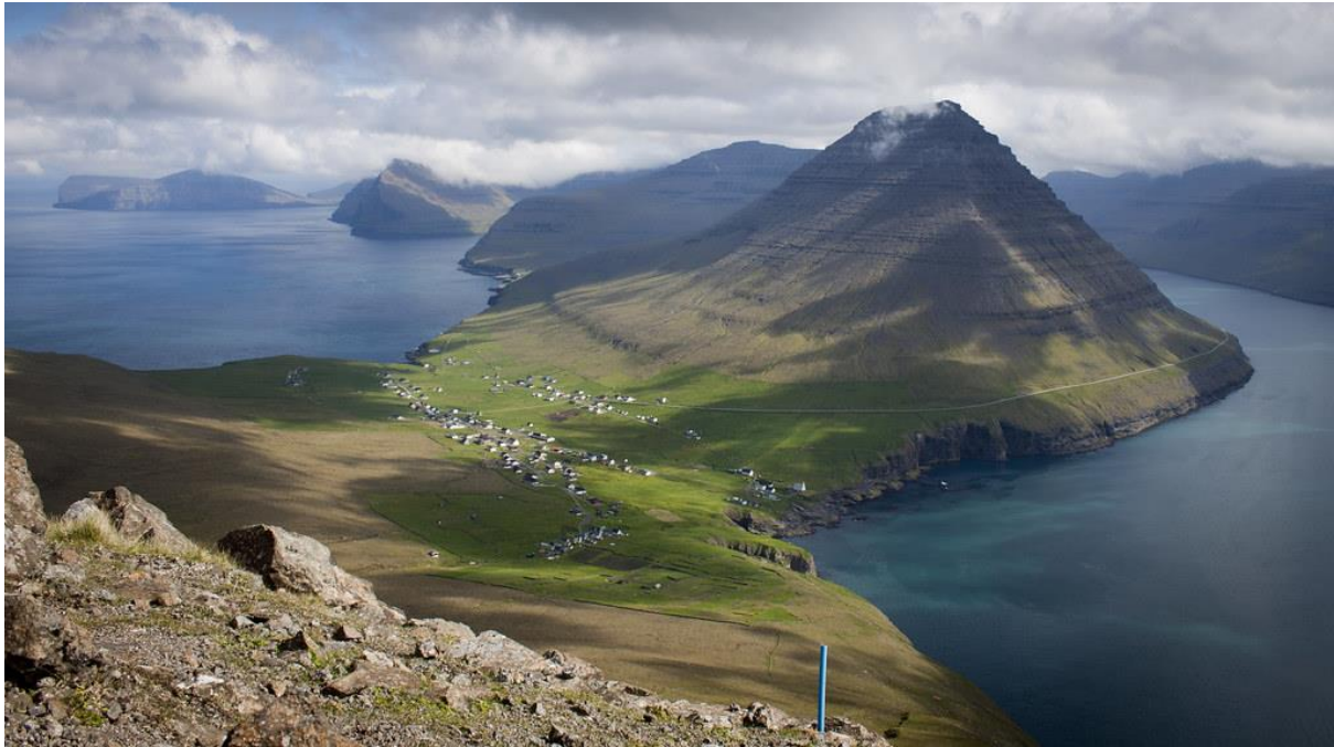
Mynd 4: Bygðin og eiðið av Villingardalsfjalli ímóti landsynningi. Eiðið vendir í landsynning eystan og útnyrðing vestan. 4 av heil- og hálvættunum fara eftir eiðinum; 4 fara tvørtur um eiðið. Fjallið sunnan fyri bygðina er Malinsfjall (750 m). Myndaánnari: Jóannes Sørensen

Eisini verður sagt um landsynning, at hann er so óreinur, at sást tú, at tað garðaði á sjónum ( andøvsgul ) undir Skógum á hesari ættini, var ov nógvur vindur at fleyga í Settorvu.