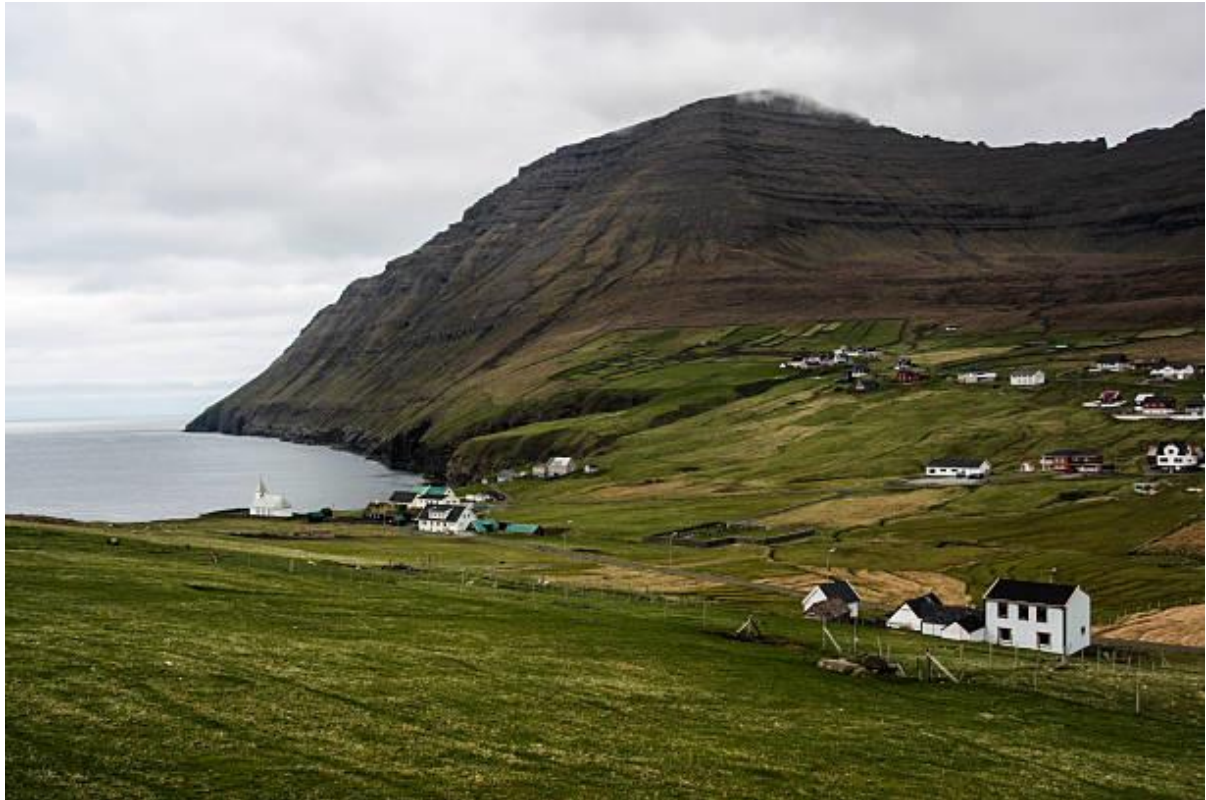
Mynd 8: Villingardalsfjall (841 m) avmyndað av Válinum í útnyrðing. Líðin gongur í útnyrðing/landsynning. Er útnyrðingur, sleppur hann heim við Líðini. Myndaánari xx xx

Annars er útnyrðingur ein góð ætt – viðingar ræðast ikki ættina. Góð ætt at turka kjøt. Tá ið tað regnar á útnyrðingi, og krovini í hjallunum gerast vát, er tað ikki keðiligt fyri kjøtið, sum tað er á landsynningi.