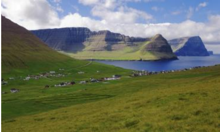
Mynd 6: Myndin tikin av Eggini í ein útsynning.

Yvirhøvur er útsynningur ein góð ætt á Viðareiði. Mesta sólin er av útsynningi og útsynningi vestri.