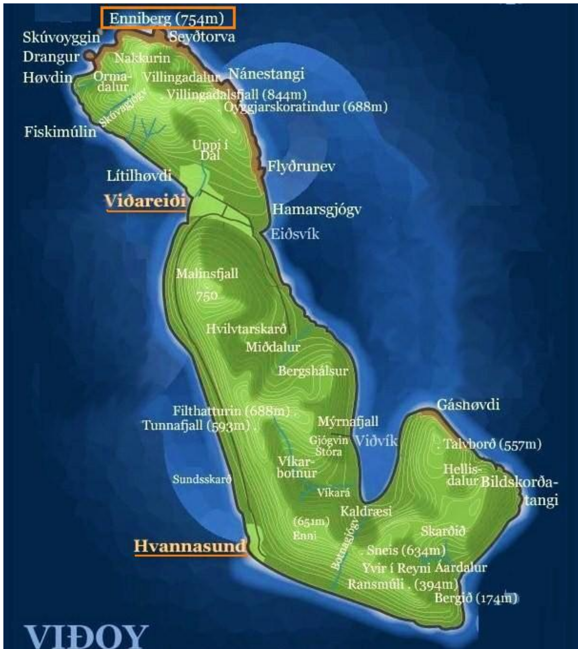
Mynd 1: Kort av Viðoy. Bygðirnar báðar á oynni, fjøllini og onnur staðarnøvn síggjast.

Norðan fyri eiðið og harvið eisini bygðina og í ein útnyrðing norðan er triðhægsta fjallið í Føroyum, Villingardalsfjall (843m). Úr Villingardalsfjalli og í landsynning er ein lægri fjallarøð, sum ímóti eggini. Sunnanfyri er Malinsfjall (750m).