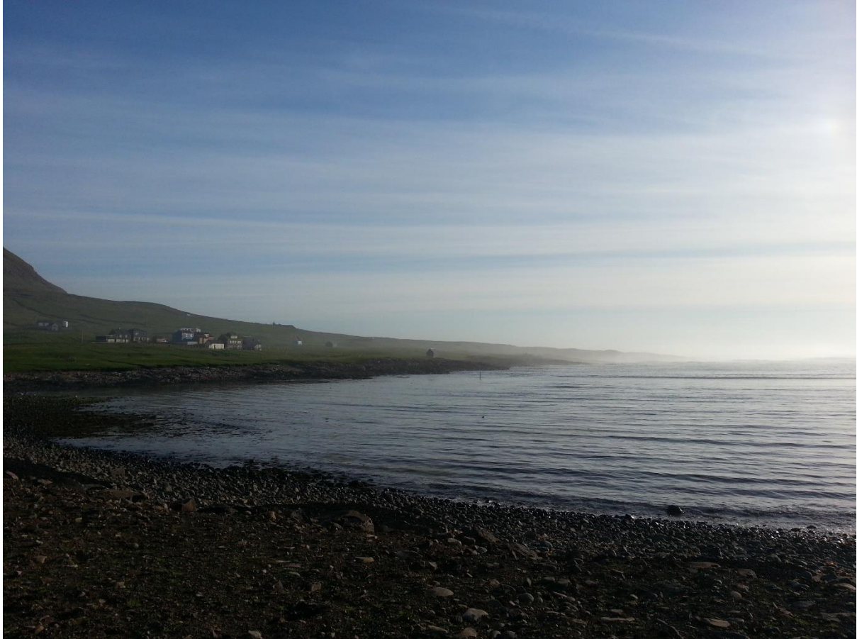
6. myndin: Hátrýstveður. Eitt lítil lot vestaneftir um kvøldið 4. juni 2013. Tám ella pollamjørki vestan fyri oynna. Stendur inn á Sundið. Í bygdini er góðveður.

Vestan er ein miðalgóð ætt í Fámjin. Hon kemur uttan av havi og er køld – merkist betri í bygdini enn útsynningur.