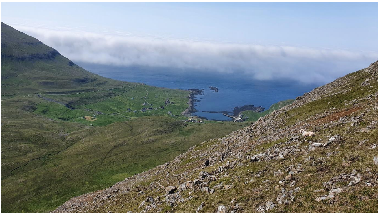
5. myndin: Hann lotaði av útsynningi nakrar dagar fyri Ólavsøku 2021. Mjørki av útsynningi rekur norður við landinum – kemur ikki inn til bygdina.

Í bygdini er vindurin javnur, og vindferðin er væl minni, enn hon er fyri landið.