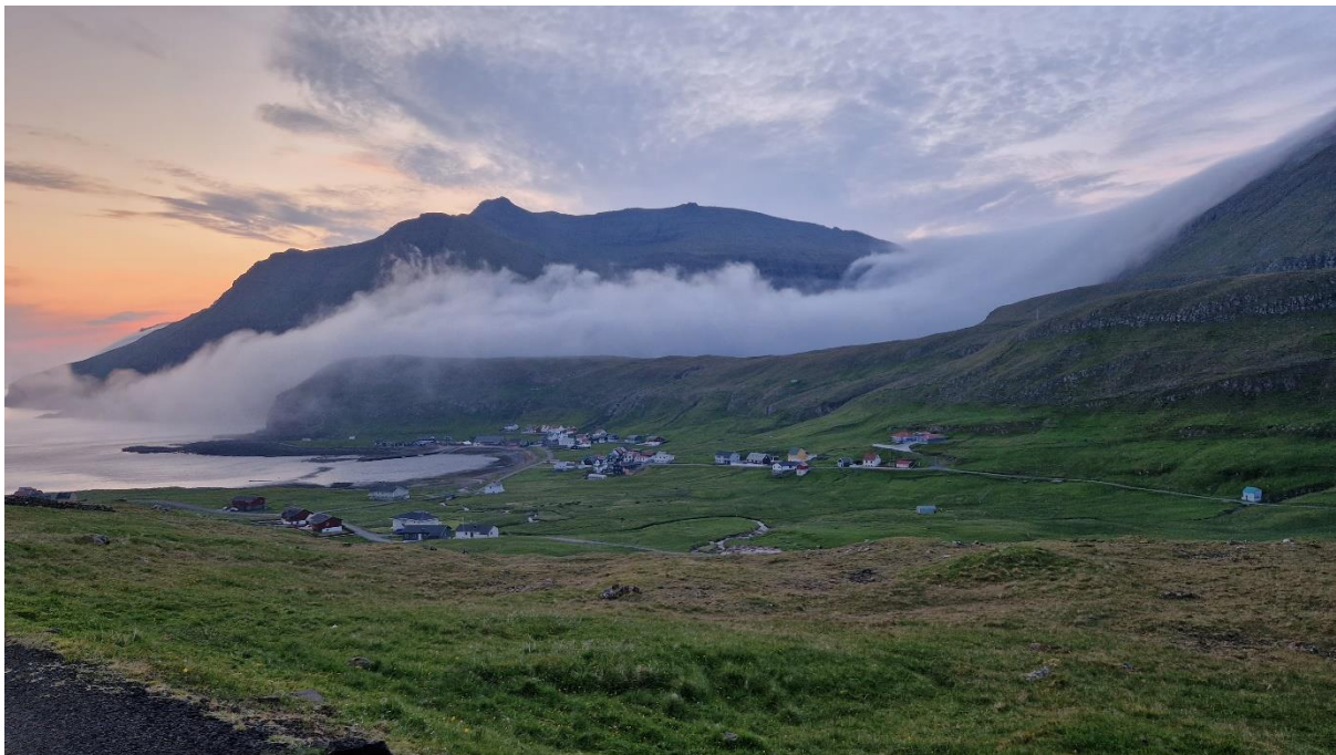
2. myndin: Eitt summarkvøld um sólsetur, 14. juni 2023. Í Vatninum sæst ættin koma av landnyrðingi. Mjørkin kemur upp um Valdaskarð og fer oman ímóti Kirkjuvatni og so á sjógv. Í bygdini er klárt. Mynd: Arni Teindal.

Landnyrðingur kemur oman av Valdaskarði og Kirkjuvatni og er ein keðilig ætt í Fámjin. Hon er vát og gjøgnumtreingjandi. Fólk í bygdini, sum gera við hús ella urtagarð, kroka undan ættini, tí tað er ikki verandi vindmegin.