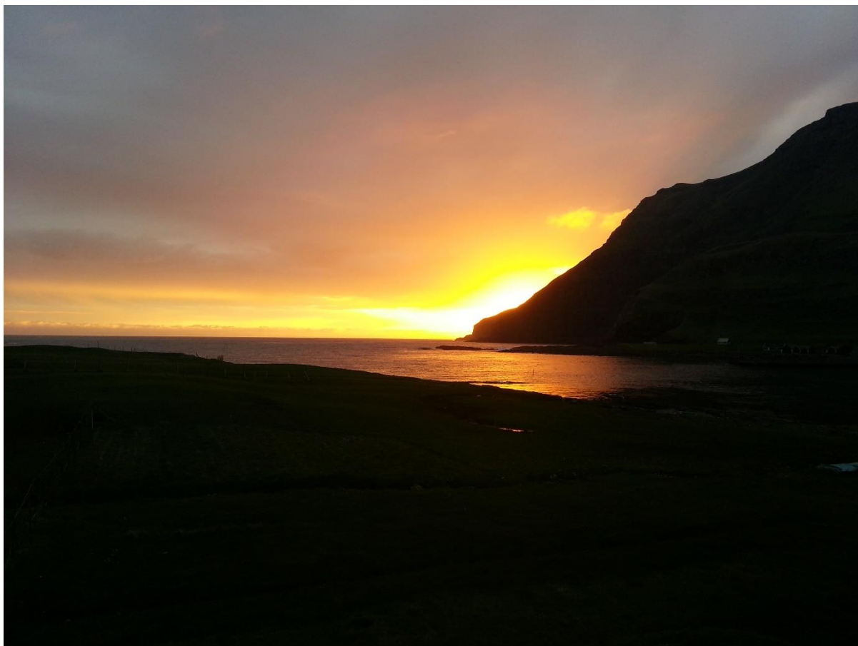
7. myndin: Sólsetur 2. juni 2015. Eitt av útnyrðingi, og loftið er skýggjað.

Útnyrðingur er ikki nøkur dreymaætt í Fámjin. Ættin er køld og trá og blívur við og við.