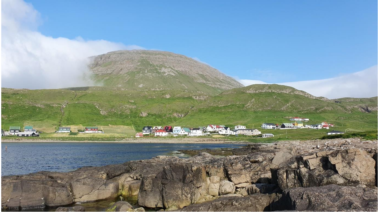
4. myndin: Eitt lítið lot av landsynningi 27. juli 2019 – á hásumri. Mjørki er eystanfyrri, og hann hevur hug at koma yvirum í støðum. Í bygdini er klárt og bláur himmal.

Landsynningur kemur oman ígjøgnum dalin og er avbera góð ætt um summarið, tá ið veðrið er gott. Tá ið mjørkin fjalir støð, har sum mjørki er á landsynningi, t.d. Tvøroyri og Havn, er stilli og sól í Fámjin.