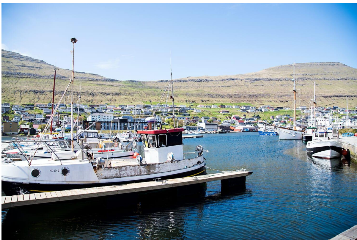
Mynd 10: Ímóti vestri.

Tá ið hann liggur av vestri, er vindurin ójavnur í Klaksvík, tá ið vindferðin er meiri enn ein strúkur í vindi. Hann kemur oman av fjallarøðini. Í Víkunum er púra stilt á vesturættini, tá ið fitt av vindi er kring landið.