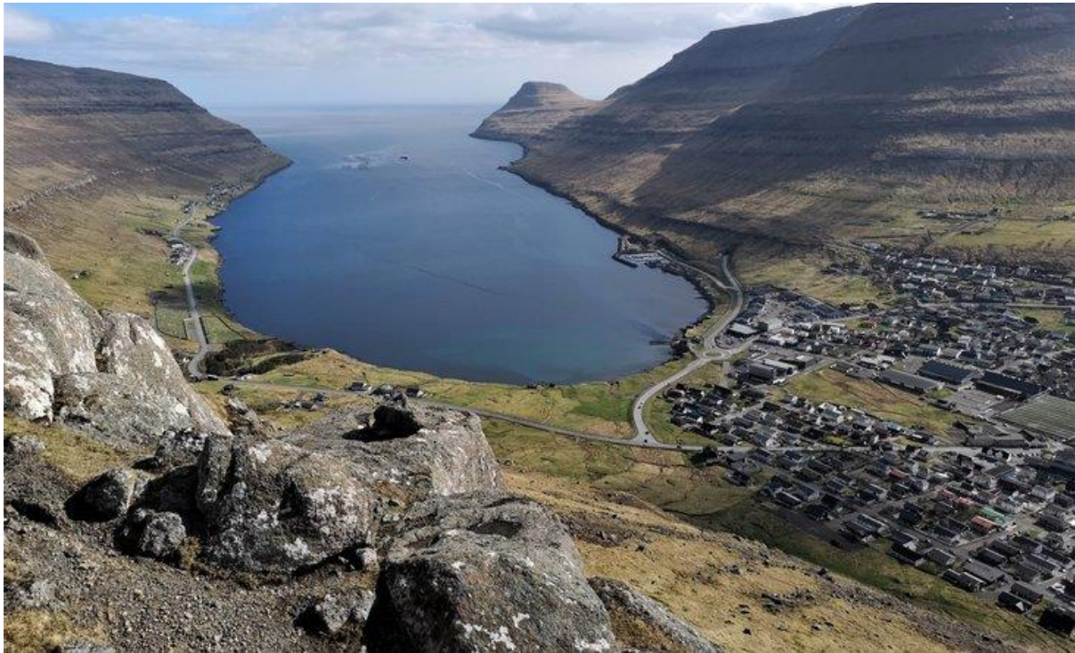
Mynd 7: Ímóti landsynningi suðuri.

Veðrið í Klaksvík á landsynningi suðuri líkist veðrinum á landsynningi.