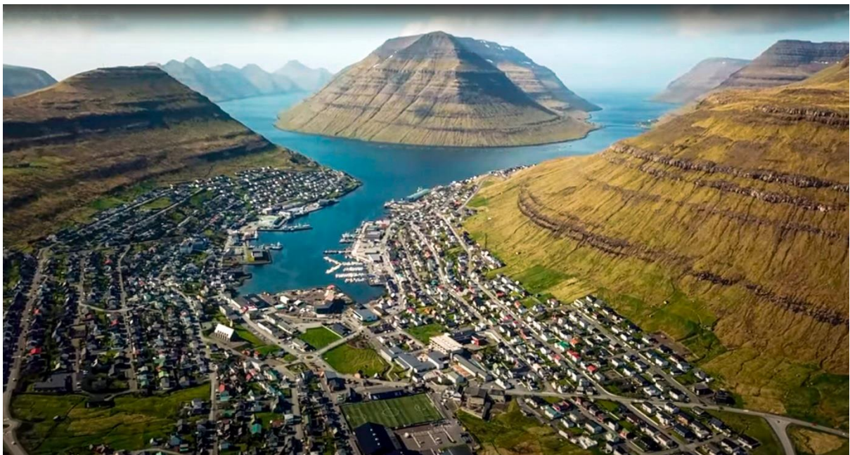
Mynd 12: Ímóti útnyrðingi.

Útnyrðingur liggur javnur suður ígjøgnum fjørðin.