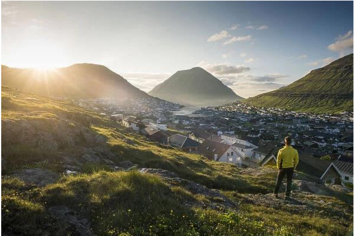
Mynd 8: Klaksvík úr suðuri.

Á suðurætt er vindurin javnur – kemur ikki í hvirlum. Vindferðin er tann sama sum miðalvindurin fyri alt landið.