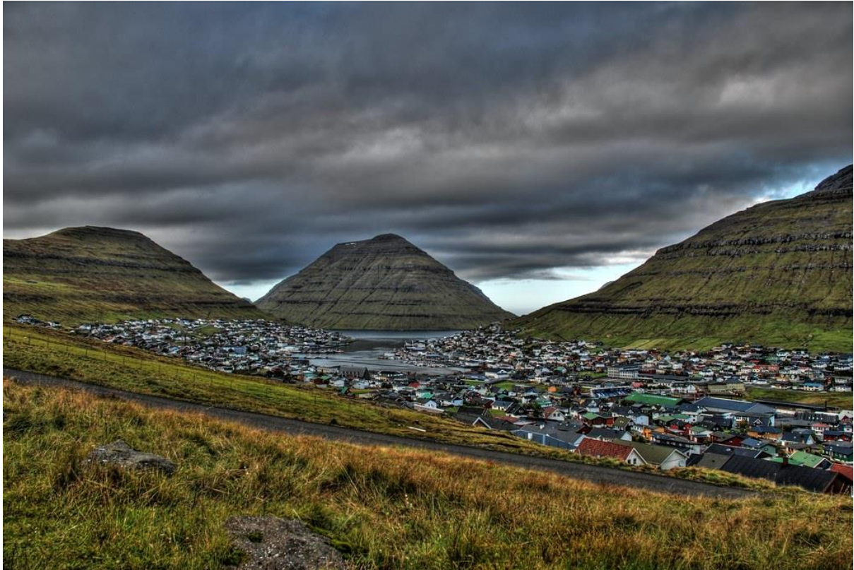
Mynd 13: Ímóti útnyrðingi norði.

Veðrið í Klaksvík á útnyrðingi norði líkist veðrinum á norði.