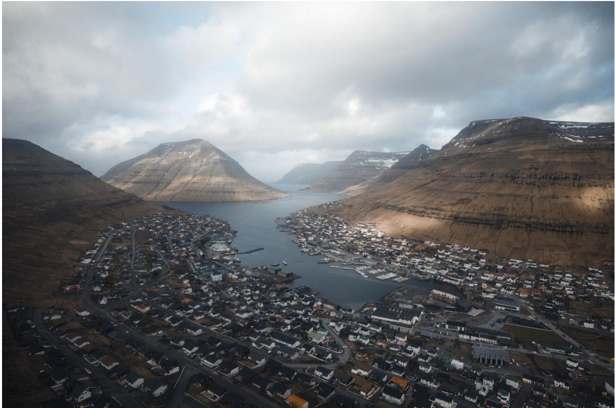
Mynd 3: Ímóti norði.

Norðan fer meira vesturyvir og strekkir seg longri enn landnyrðingur ( tráur ). Tað kundi vera tungt at koma út av víkini, tá ið hann koma av norði, men útkomin var betri.