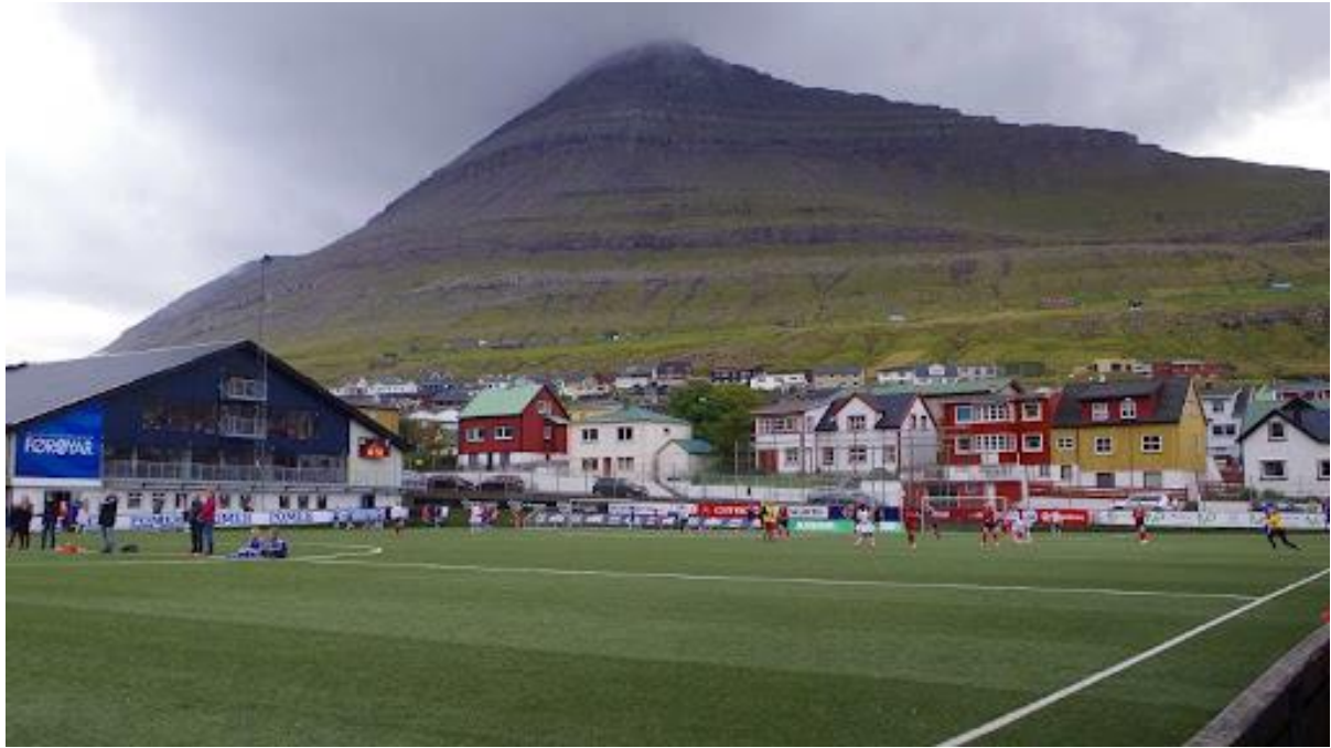
Mynd 9: Av vøllinum við Djúpumýru í Klaksvík ímóti útsynningi.

Vindurin á útsynningi er javnur og fer út eftir vánni. Vanliga er lítil vindur á ættini, til miðalvindferðin fyri landið er farin upp um hvassan vind.