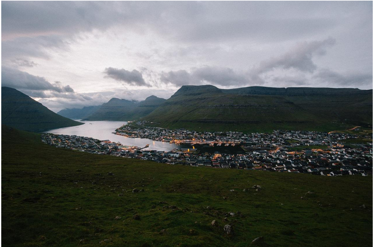
Mynd 4: Ímóti landnyrðingi.

Vindur er javnur í Klaksvík, tá ið ættin er landnyrðingur, og vindferðin er nakað tað sama sum fyrri landið.