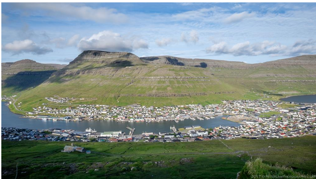
Mynd 5: Ímóti eystri.

Vindurin á eystri er javnur í Klaksvík og fer út eftir vánni. Tað er ikki meiri vindur enn miðalvindferðin fyri landið.