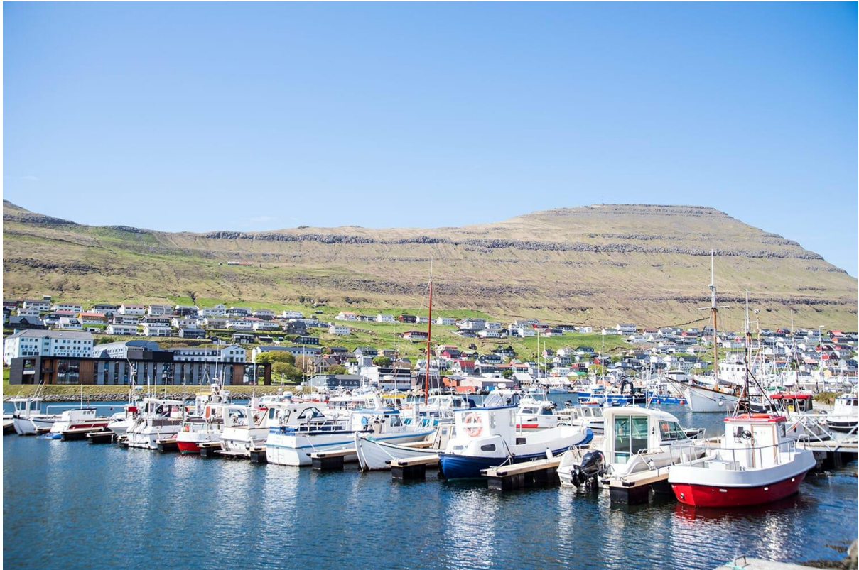
Mynd 11: Av bátabrúgvunum ímóti útnyrðingi vestri.