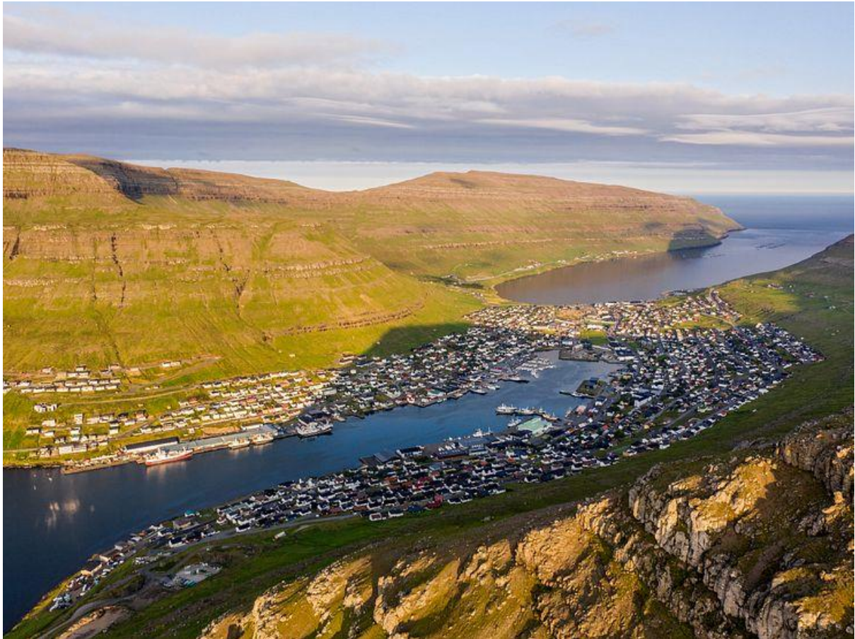
Mynd 6: Ímóti landsynningi

Tá ið hann liggur av landsynningi er javnur vindur ut eftir vánni. Hann sæst liggja tráur norður eftir fjøllunum – skaddur eftir fjøllunum á vestara armi.