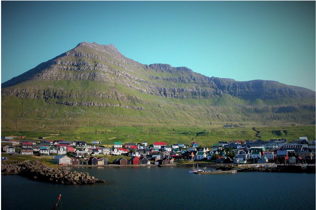
Mynd 5: Myndin tikin ímóti landsynningi suðuri. Veðrið á hesari ættini líkist veðrinum á suðuri.