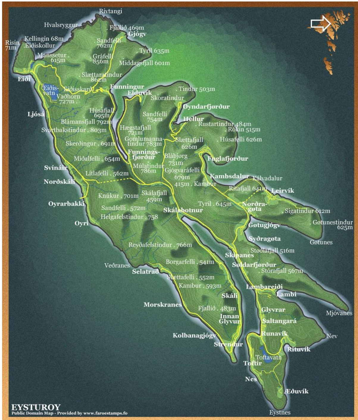
Mynd 1: Kort av Eysturoy. Leirvík er á eystursíðuni, miðskeiðis á oynni.

Í landsynning úr Leirvíksbygd er Sigatindur (612m) og í útsynning úr bygdini er Knúkur (460m). Úr Sigatindi og vestur til Knúk er ein lægri fjallarøð. Í beinan vestan úr bygdini er Ritafjall (641m).