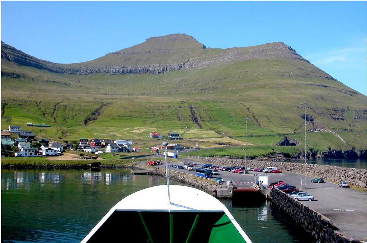
Mynd 6: Sunnan fyri brimgarðin ímóti vestri.