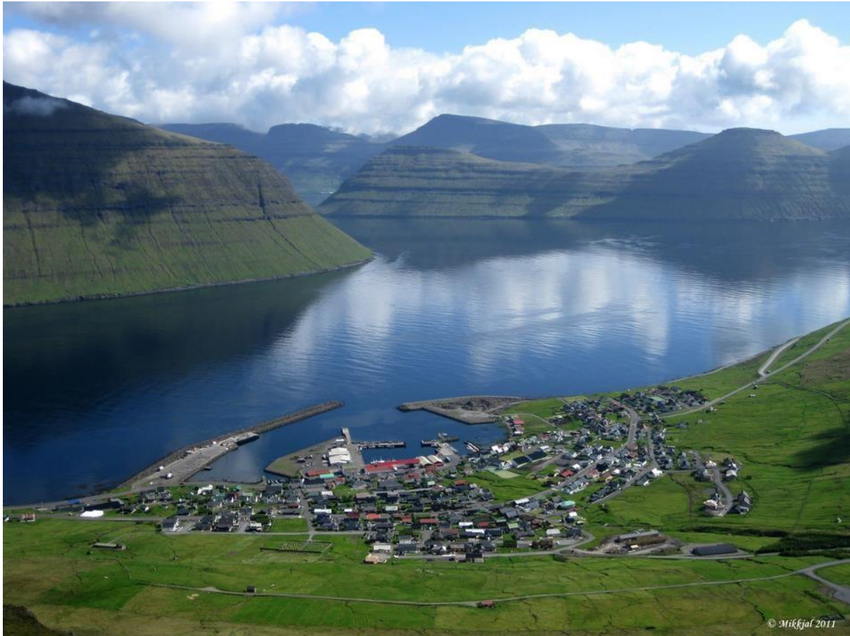
Mynd 4: Myndin tikin í landnyrðing eystan. Á hesari ættini líkist veðrið veðrinum á landnyrðingi.