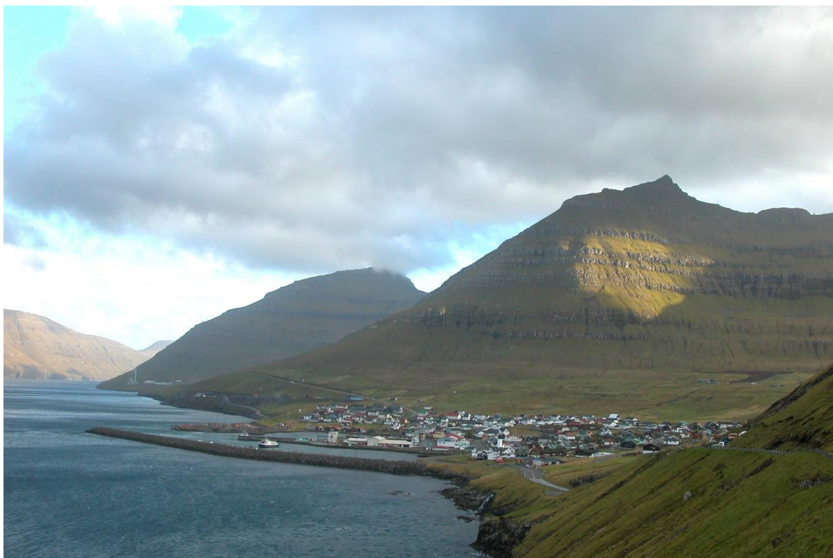
Mynd 5: Myndin tikin í landsynning eystan. Liggur hann av landsynningi eystri, er kann veðrið vera eitt sindur keðiligt.

Veðri er nakað frægari ætt enn landsynningur. Tó er hann nakað keðiligur.