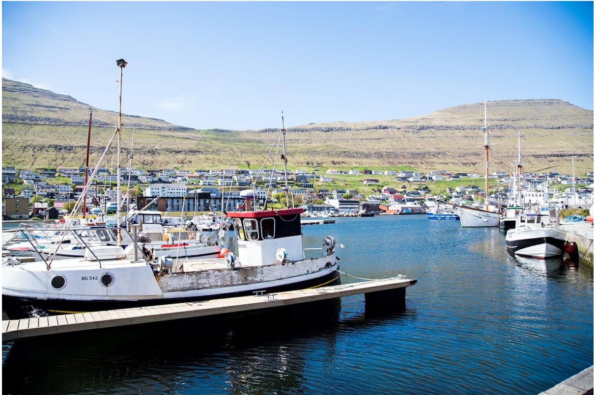
Mynd 10: Ímóti vestri.

Tá ið hann liggur av vestri, er vindurin ójavnur í Klaksvík, tá ið vindferðin er meiri enn ein strúkur í vindi. Hann kemur oman av fjallarøðini. Í Víkunum er púra stilt á vesturættini, tá ið fitt av vindi er kring landið.