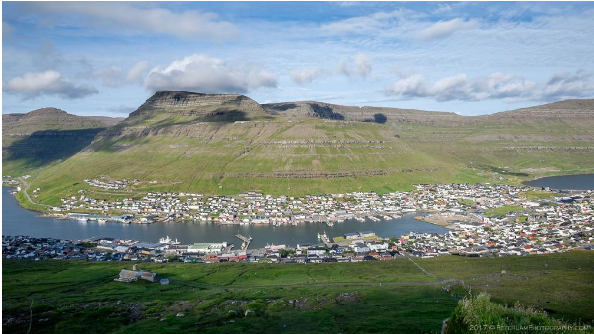
Mynd 5: Ímóti eystri.

Vindurin á eystri er javnur í Klaksvík og fer út eftir vágni. Tað er ikki meiri vindur enn miðalvindferðin fyri landið.