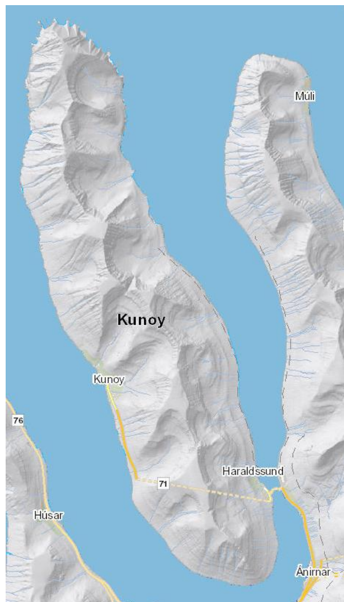
Mynd 1: Kort av Kunoy. Bygdin Haraldssund liggur út ímóti sundinum, Haraldssundi. Har bygdin er, er sundið smalt – um 400 til 500 metrar.

Fjøllini eru í høvuðsheitum Snæfelli (644m) og Lokkin (754m).