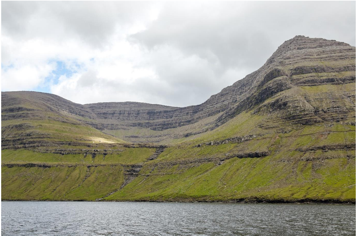
Mynd 7: Veðrið í Haraldssundi á landnyrðingi eystri er sum veðrið, tá ið ættin er eystan. Hann kemur úr Svartadali yvir um sundið.