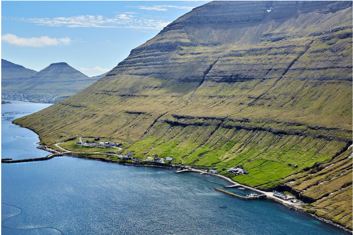
Mynd 5: Veðrið í Haraldssundi á landnyrðingi norði er eitt bland av veðrinum, sum er á norði og landnyrðingi.