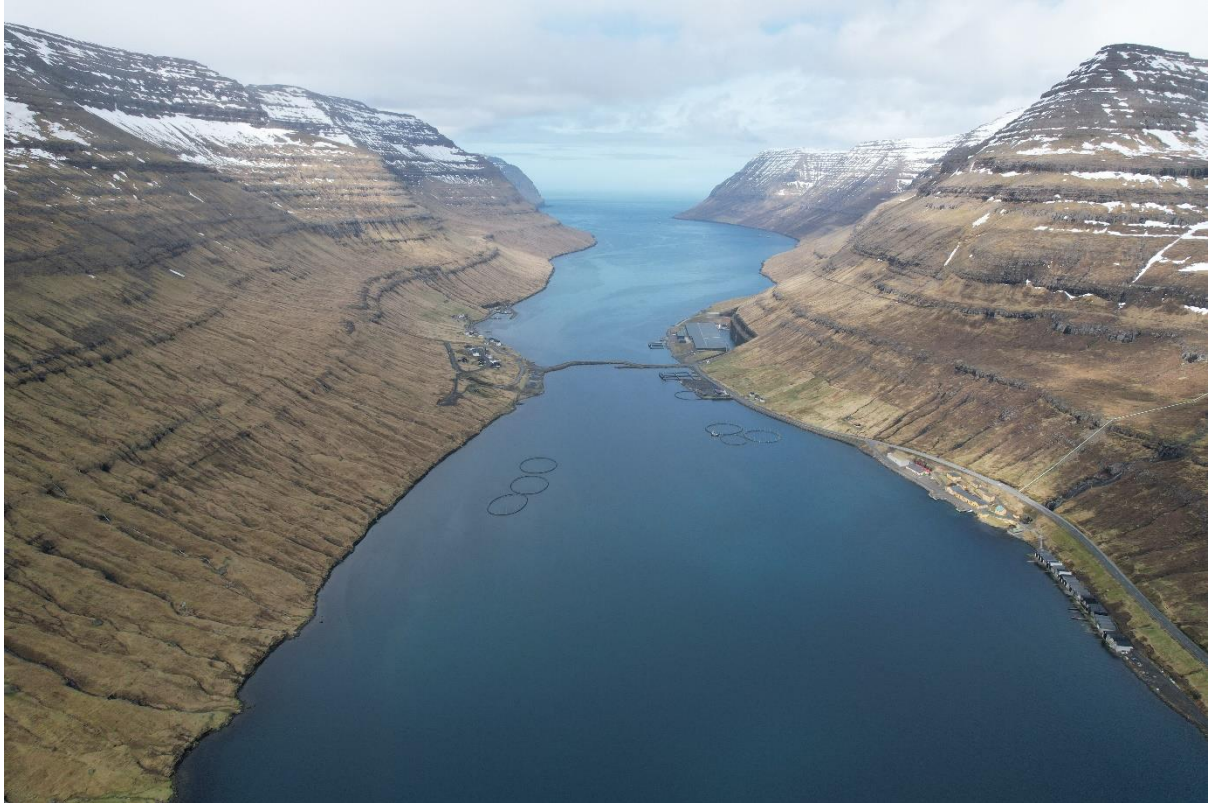
Mynd 4: Myndin tikin norður ígjøgnum Haraldssund. Tá ið ættin er norðan, er javnur vindur suður ígjøgnum sundið. Vindferðin er tað sama sum fyri landið. Norðan er ikki ein vát ætt, tað regnar sum fyri landið. Mjørki kann vera norðuri í sundinum, men røkkur ikki suður til bygdina. Norðan er ikki skaðað.