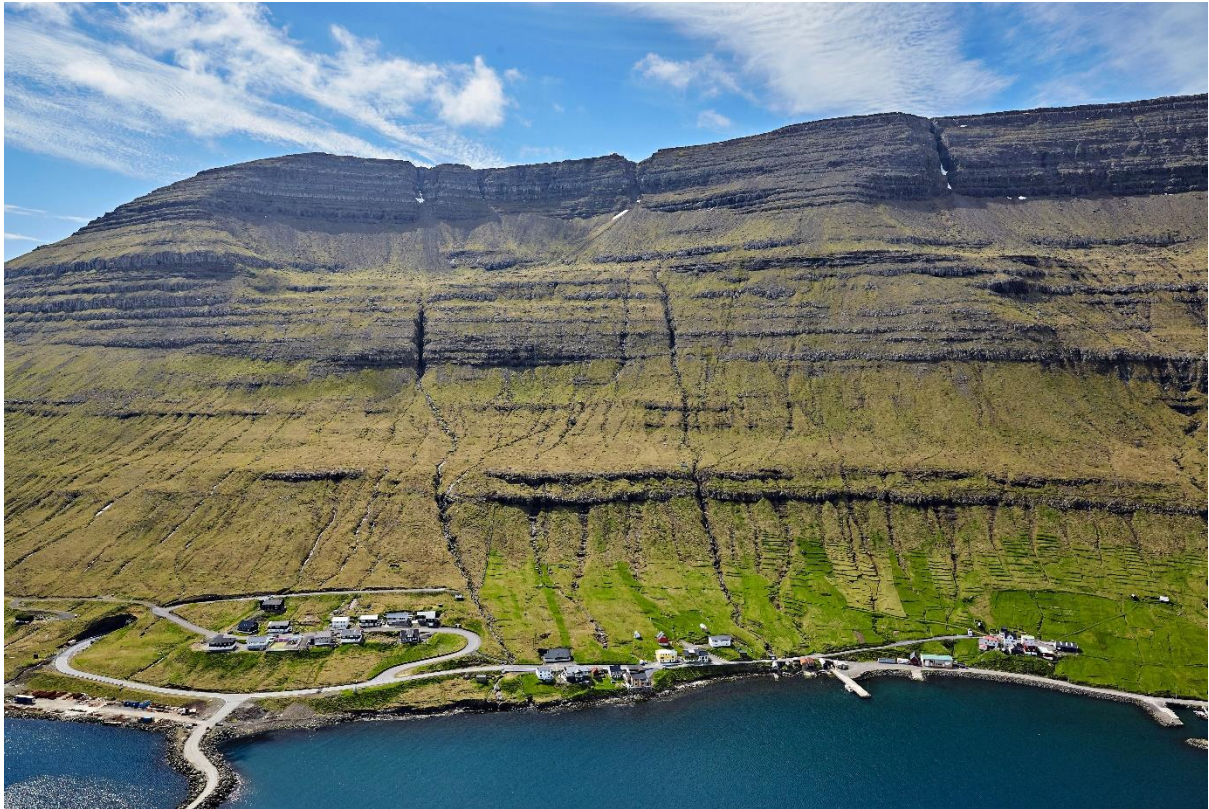
Mynd 8: Myndin tikin av Haraldssundi av eystri. Á hesari ættini slær vindurin ímóti Galvskorafjalli og fer yvir aftur ímóti Borðoyggi. Vindurin er javnur, og vindferðin eitt sindur minni enn sagt fyri landið. Ættin kann vera vát, er lítil vindur á vetri, legst kavi viðhvørt. Eystan er mjørkaætt í Haraldssundi í góðum veðri. Í Haraldssundi rokna tey eystan sum eina góða ætt.