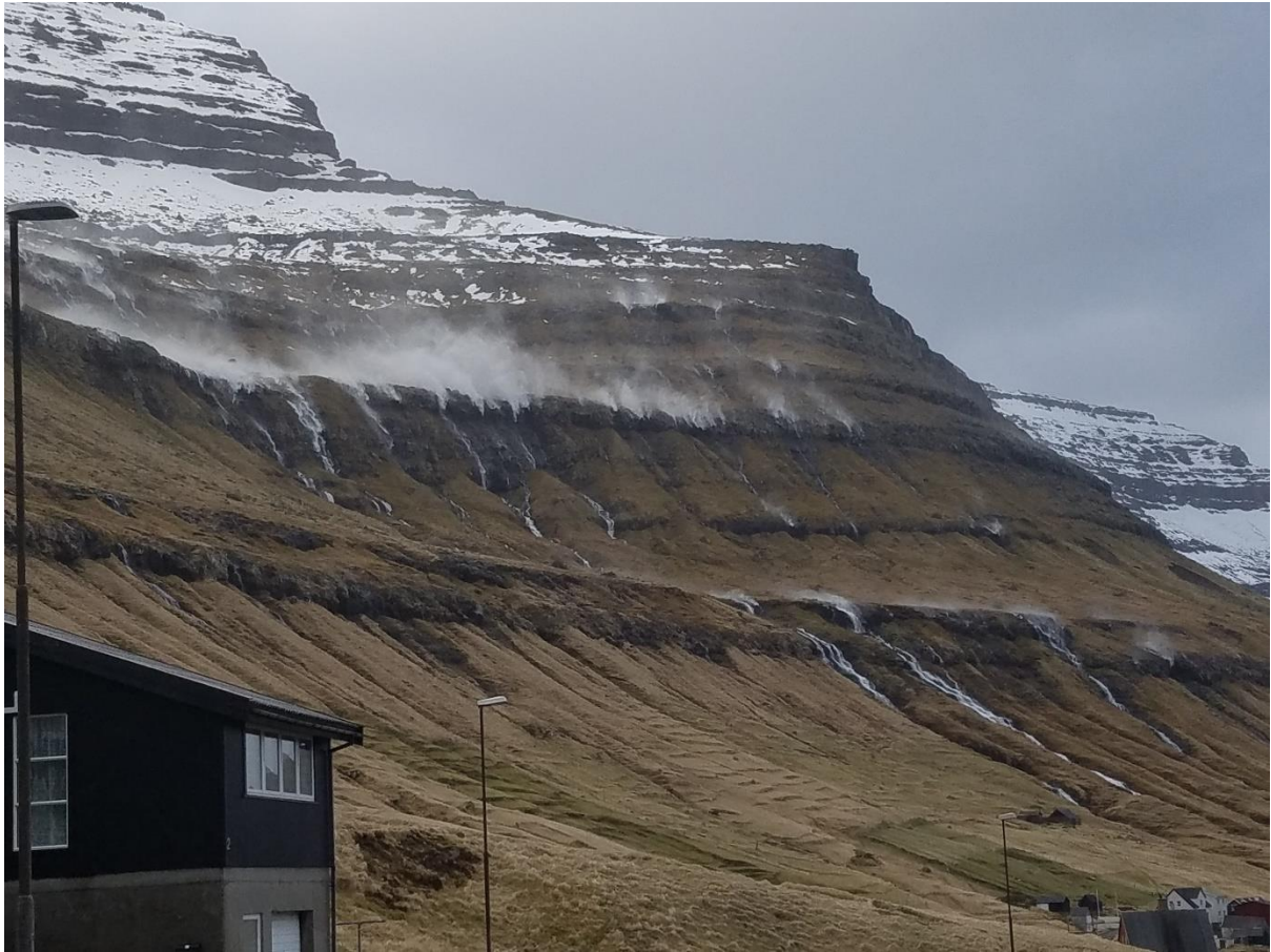
Mynd 12: Útsynningur vestan er ringasta ættin í Haraldssundi. Allar áirnar norðan fyrri bygdina (Garðáirnar) og uppi á Fossum rúka, tá ið tað er nógvur vindur. Vindurin kann vera rættiliga ójavnur við nógvum hørðum hvirlum. Skaðaætt. Vindferðin er nógv meiri enn miðal fyrri landið. Í góðveðri um summarið er góður terri á ættini. Mjørki er ikki á útsynningi vestri.