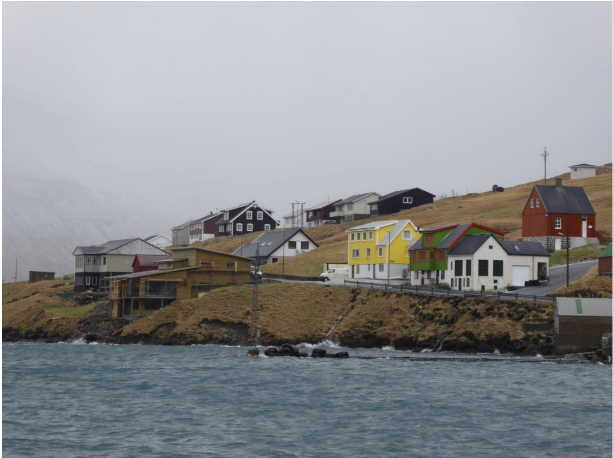
Mynd 14: Útnyrðingur strekkir ekki sundið, men slær ímóti Borðoyinni á veg suðureftir og kemur til bygdar sum av landnyrðingi. Vindurin er javnur, og vindferðin er tann sama sum fyri landið. Ættin er ikki vát ella mjørkaætt. Í Haraldssundi siga tey ættina vera eina hampuliga góð ætt, tó at tað runar meira enn á hinum ættunum.