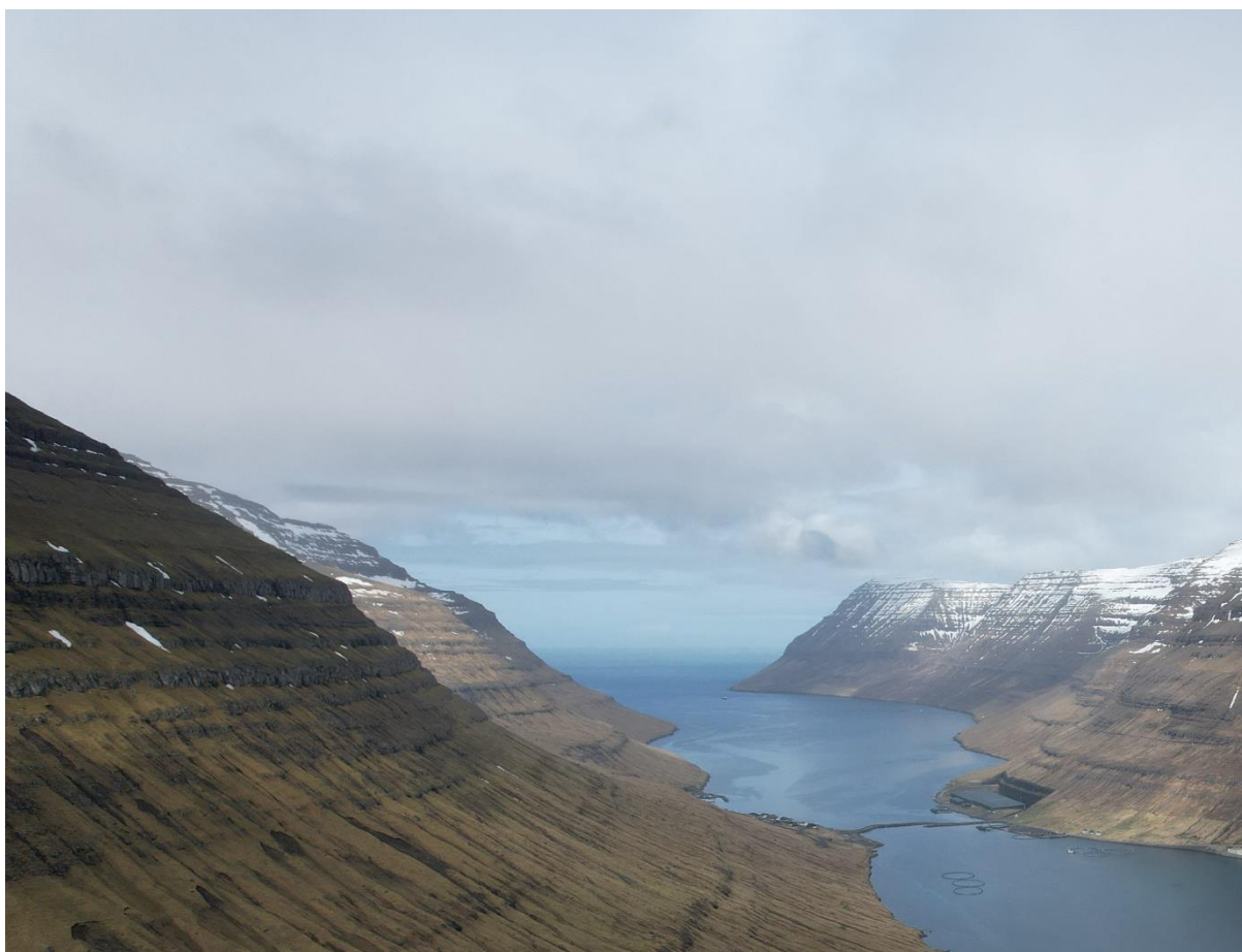
Mynd 15: Tá ið ættin er útnyrðingur norðan, líkist veðrið í Haraldssundi veðrinum, tá ið ættin er norðan.