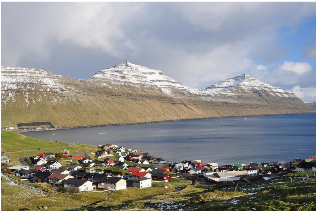
Mynd 4: Ímóti landnyrðingi

Tá ið hann liggur av landnyrðingi, kemur hann av Stórugjógv inn á Syðrugøtu.