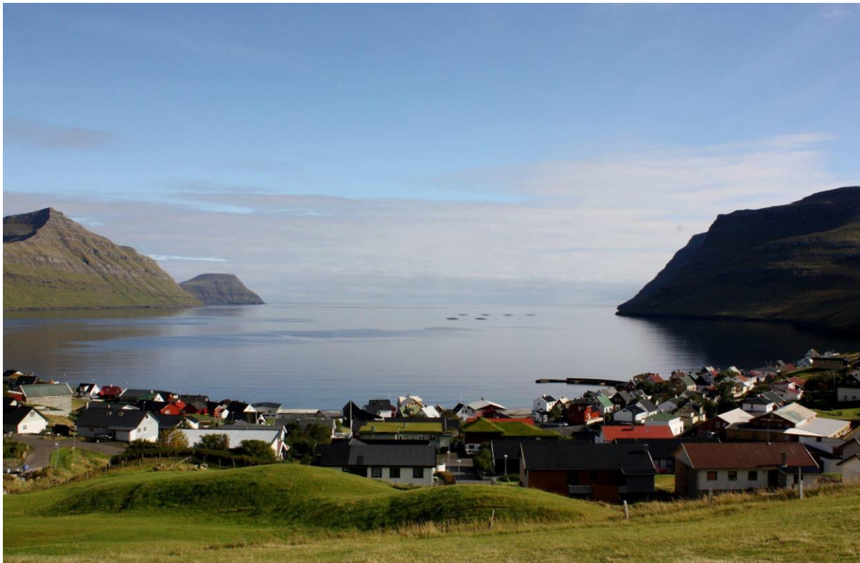
Mynd 5: Ímóti landsynningi eystri

Veðrið á landsynningi eystri líkist veðrinum á landsynningi. Tað kann gott vera brim á ættini.