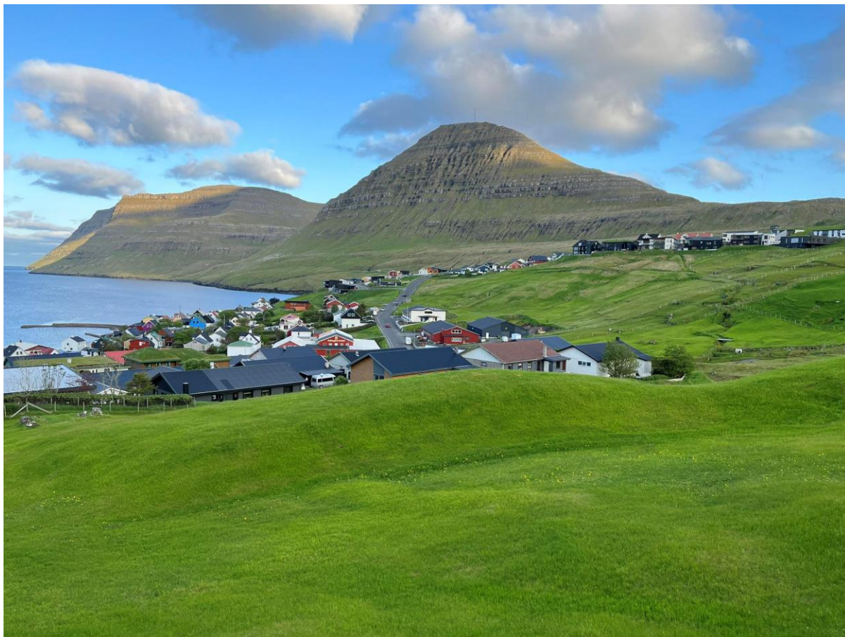
Mynd 7: Ímóti suðuri

Fær Borðoyarnes í hampuligum veðri á sumri ein hatt – eina snøggga húgvu – er ættin beinur sunnan. Veksur hatturin norðureftir ímóti Borðoyarneshálsi, og er ikki so snøggur meir, er hann farin í landssynning sunnan, ella eina striku eystur um sunnan.