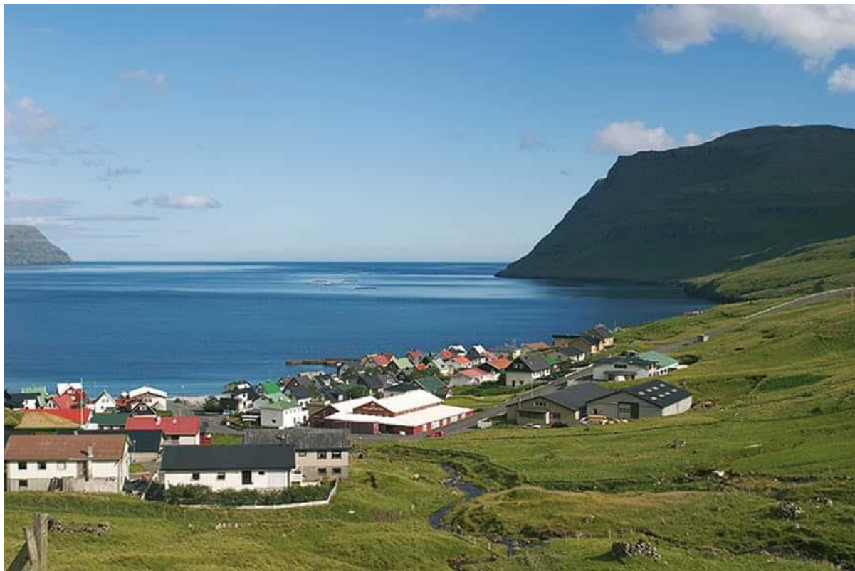
Mynd 6: Ímóti landsynningi

Tá ið ættin er landsynningur, kemur hann javnur heim eftir víkini fram við landi frá Mjóvanesi.