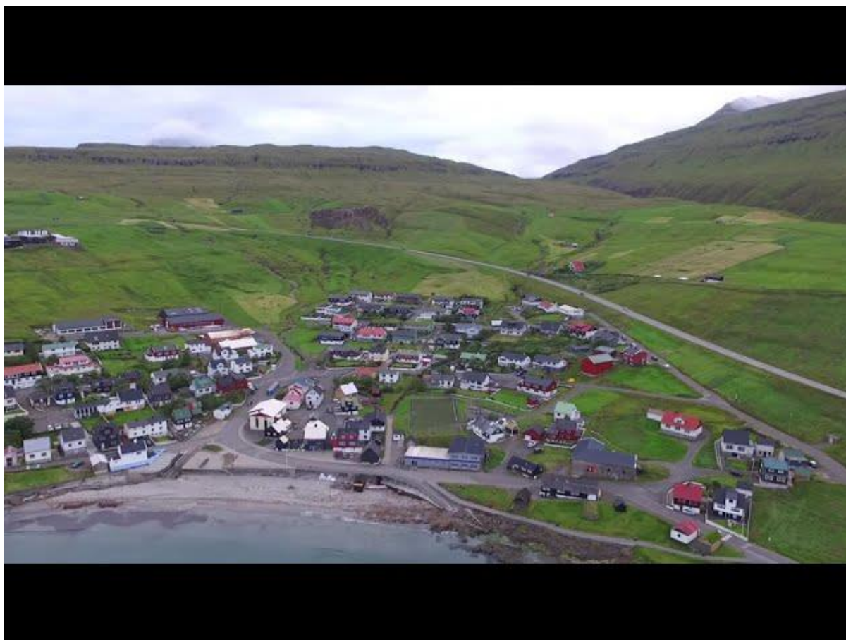
Mynd 9: Ímóti vestri

Tá ið hann kemur av vestri, kemur lotið oman av Fjalli.