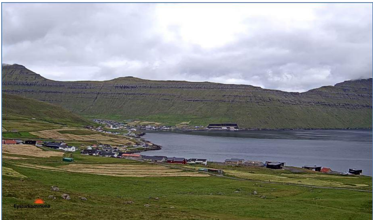
Mynd 3: Ímóti landnyrðingi norði.

Á landnyrðingi norði hoyrist lítið vil vind niðri í bygdini, men ovari í bygdini hoyrist vindurin væl. Í aðrar mátar er veðrið í Syðrugøtu á landnyrðingi norði, sum tá ið ættin er norðan.