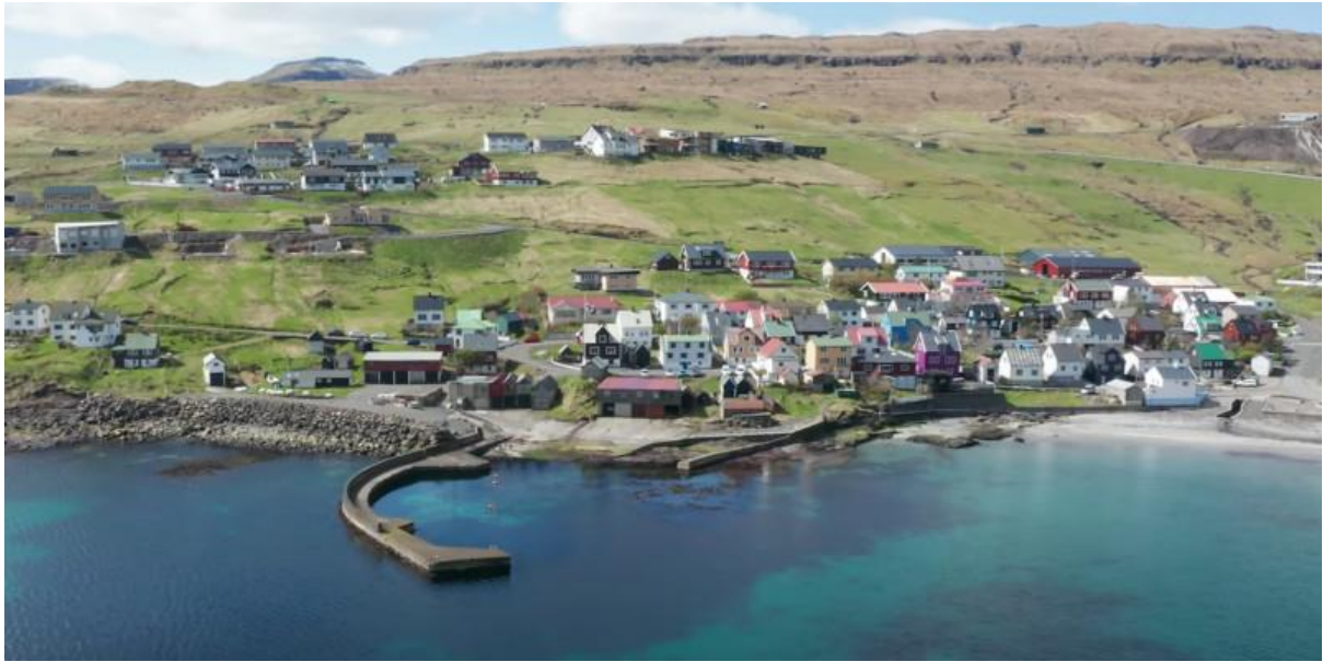
Mynd 8: Ímóti útsynningi.

Útsynningur er ójavnur, tá ið tað er nakað av vindi, líkasum ættirnar báðumegin útsynning, og tá er meira vindur í Syðrugøtu, enn tað er í landinum annars. Millum hvirlurnar kann vera stilli, men so brestur á aftur. Tað dunar í fjøllunum.