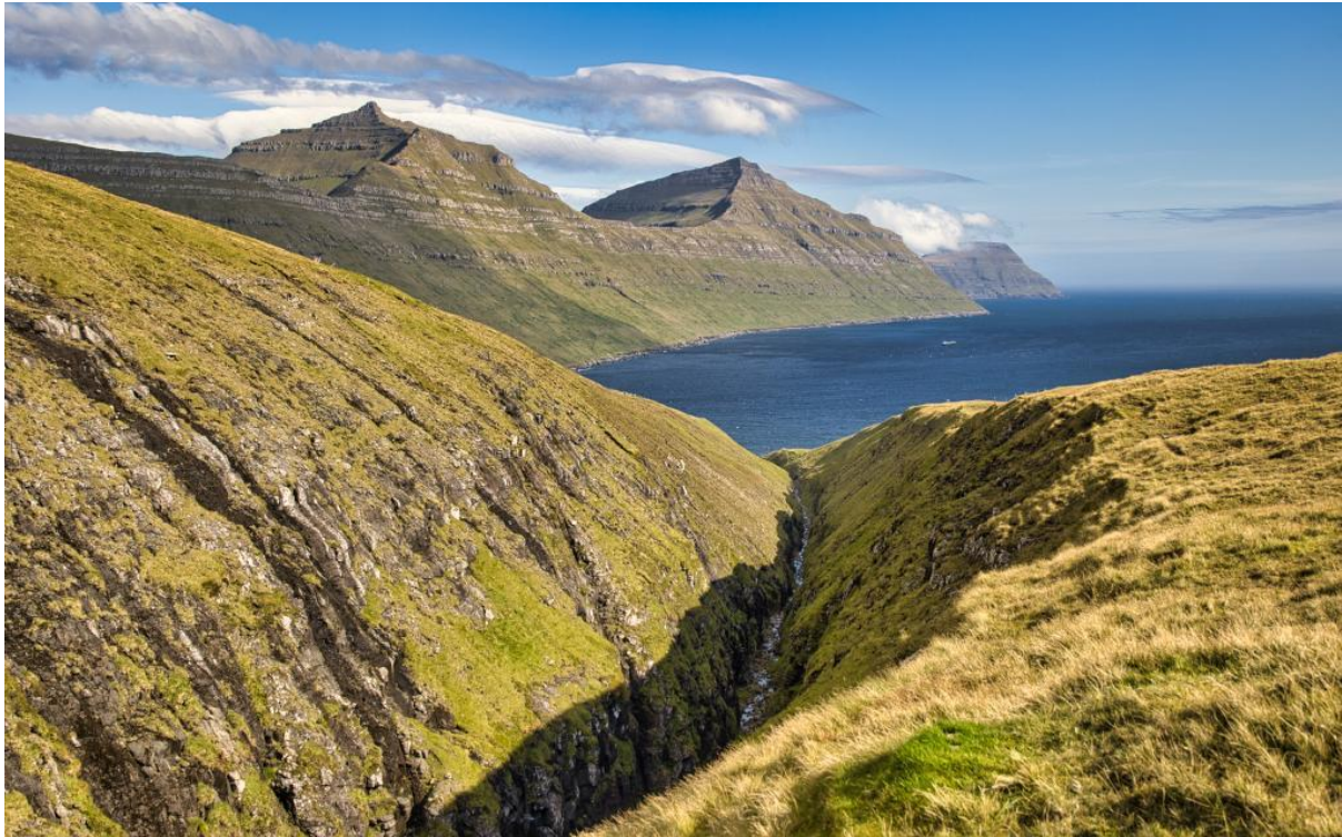
Mynd 2: Gjógvin oman fyri bygdina, avmyndað í eystri.