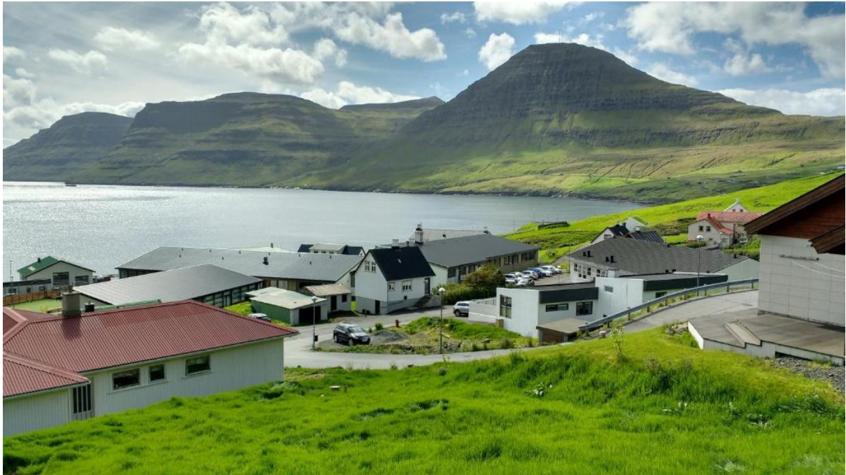
Mynd 6: Ímóti landsynningi suðuri