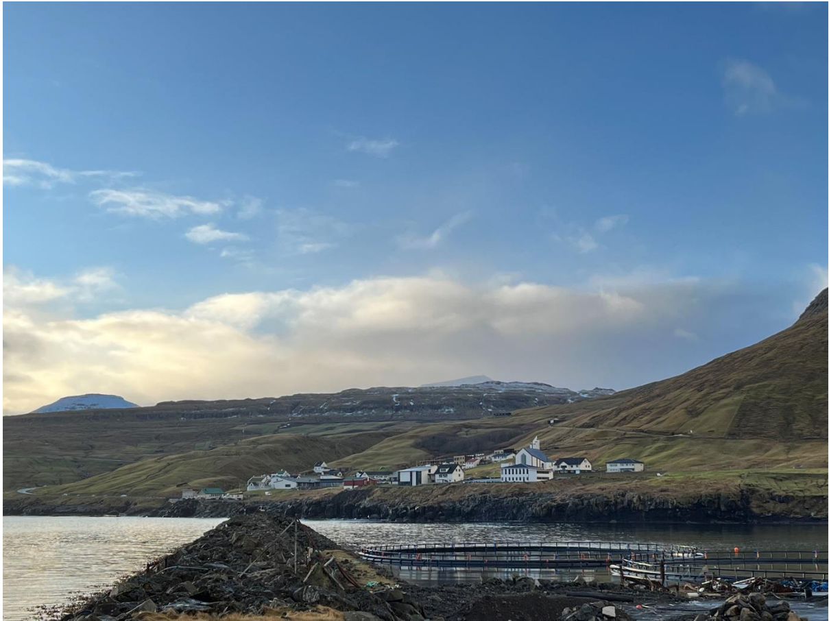
Figure 7: Ímóti útsynningi

Ættin er góð við Gøtugjógv – ikki skaðað, heldur ikki í stormi.