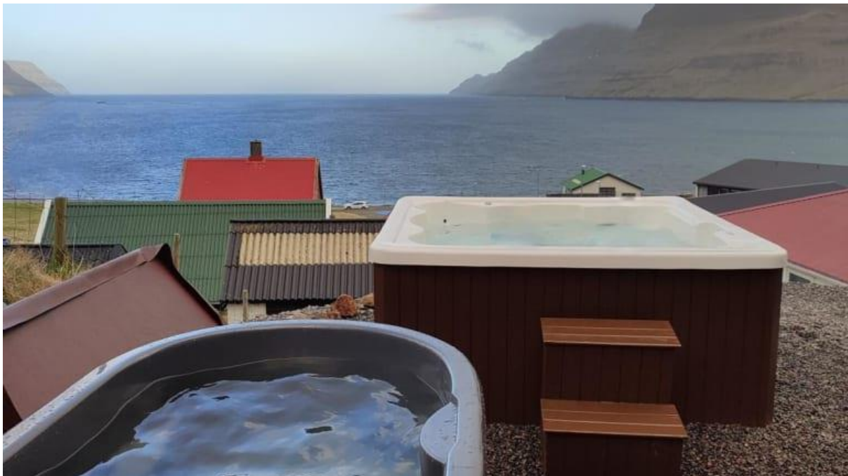
Mynd 5: Gøtuvík opin ímóti landsynningi

Landsynningur kemur beint heim eftir víkini. Vindurin erko javnur – ikki skaðætt.