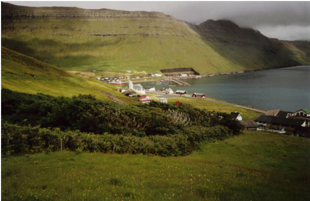
Mynd 4: Ímóti landnyrðingi

Landnyrðingur er besta ættin við Gøtugjógv. Vindurin er javnur, tá ið nógvur vindur er. Í góðveðri er stilli. Fjallarøðin ímillum Sigatind og Knúk verjir fyrri ættini.