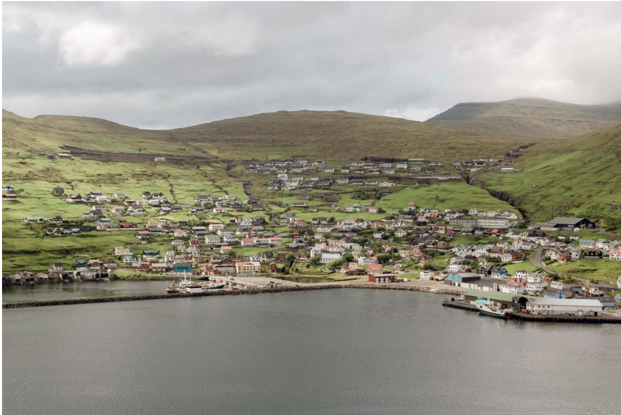
Figure 10 Myndin tikin av Kráargili í útnyrðing. Áðrenn luftin skal upp um Melin (291m), er hon farin upp umhægri fjøll longriburtur frá bygdini. Tey bæði gera vindin ójavnann niðri í bygdini við hørðum hvirlum og meiri vindi enn miðal fyri landið, og eisini skýgerð og avfall. Sjórok er í ringum veðri kring alla bygdina.

Á útnyrðingi er vindurin meiri ovarlaga í bygdini enn sagt er fyri landið. Niðri í bygdini er minni vindur.