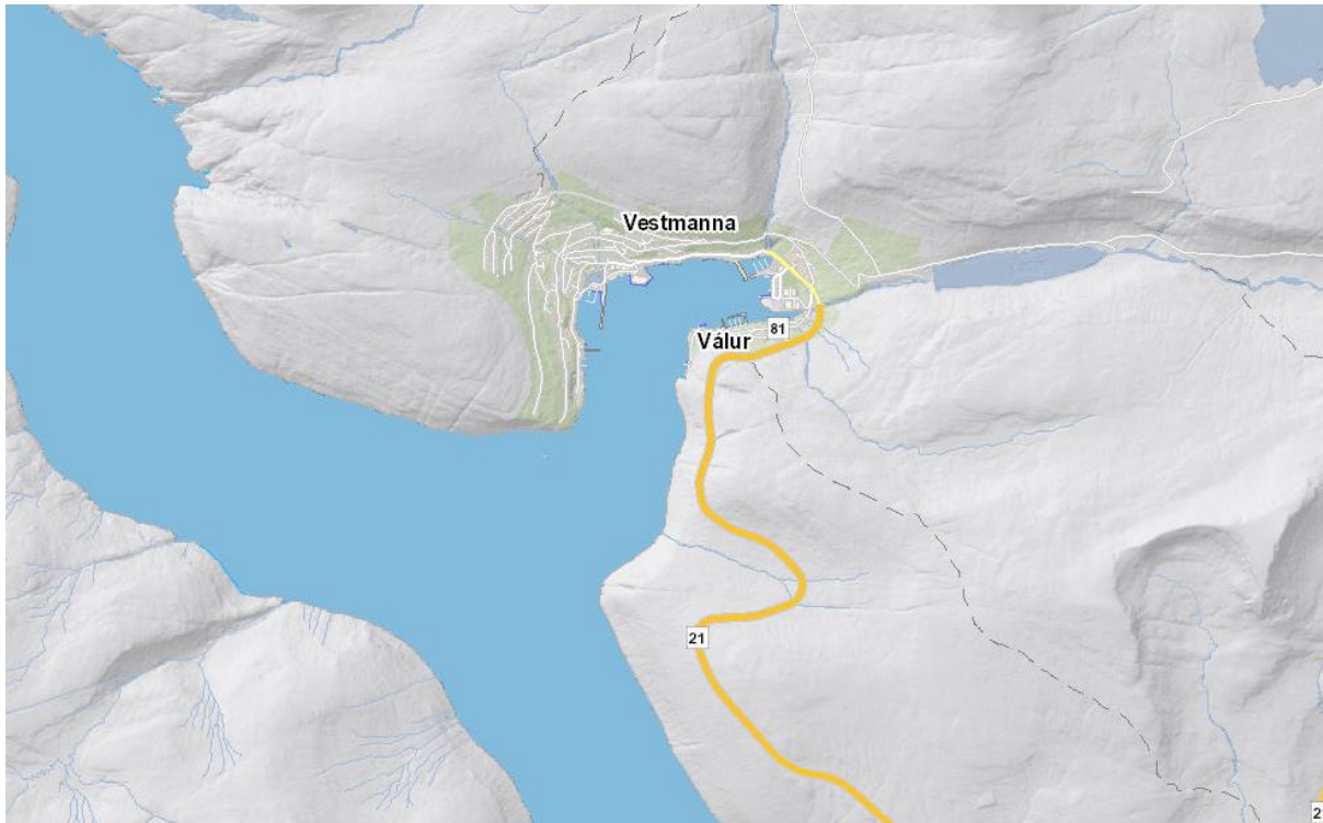
Mynd 1: Kort av Streymoy. Vestmanna er á vestursíðuni, norðan fyri miðjuna. Fjørðurin úr Vestmannasundi gongur norður og suður, men innast eystur og vestur.

Byrjandi vestureftir er Hægstafjall (295m), í útnyrðing er Melin (291m), í norðan Reynið (345m), í landnyrðing Loysingarfjall (635m), í eystan Eiðið (332m) og í landsynning Høgareyn (353m).