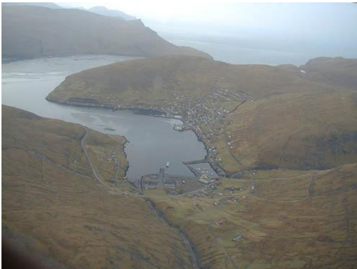
Mynd 9: Myndin tikin av Lágafjalli (650m) ímóti vestri. Vindurin má upp um Grimstaðfjall (450m), ið er norðast á Vágoyggi, áðrenn hann aftur skal upp um Hægstaðfjall (295m). Hetta verjir væl ímóti lotinum, tá ið lítil vindur er. Er nógvur vindur, kann hann vera ójavnur í støðum – serliga uttarlaga í bygdini.

Vestan roynist yvirhøvur væl út á dagin. Kann vera vátt og vindur á morgni, men veðrið roynist væl út á dagin.