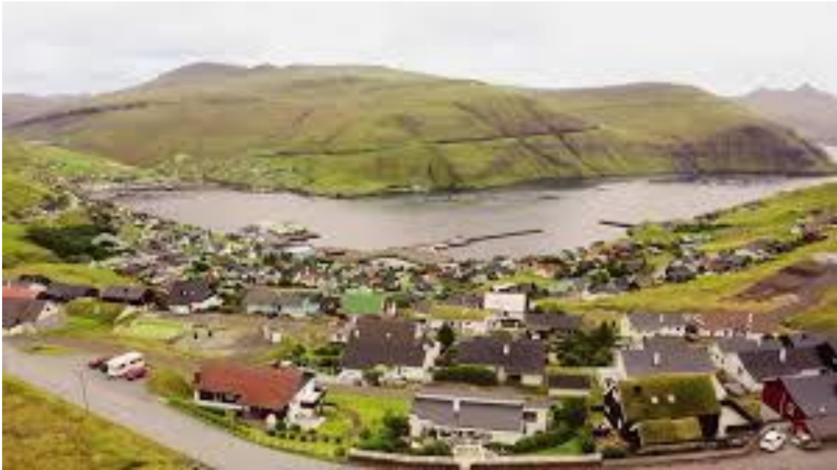
Figure 7 Myndin tikin av Miðalsbrekku ímóti landsynningi. Luftin fer upp um miðalhøg fjøll, áðrenn hon er í bygdini. Vindurin er ójavnur – inni á Fjørð eru hvirlur. Vindferðin er eitt sindur meiri enn hon er fyri alt landið. Kann vera vátt á ættini. Besta summarætt, men ein tann ringasta um veturin. Runar undir gassá, er ikki farandi inn í holurnar undir Vestmannabjörgunum.

Landsynningur kann vera vátur, men er ikki mjørkaætt.