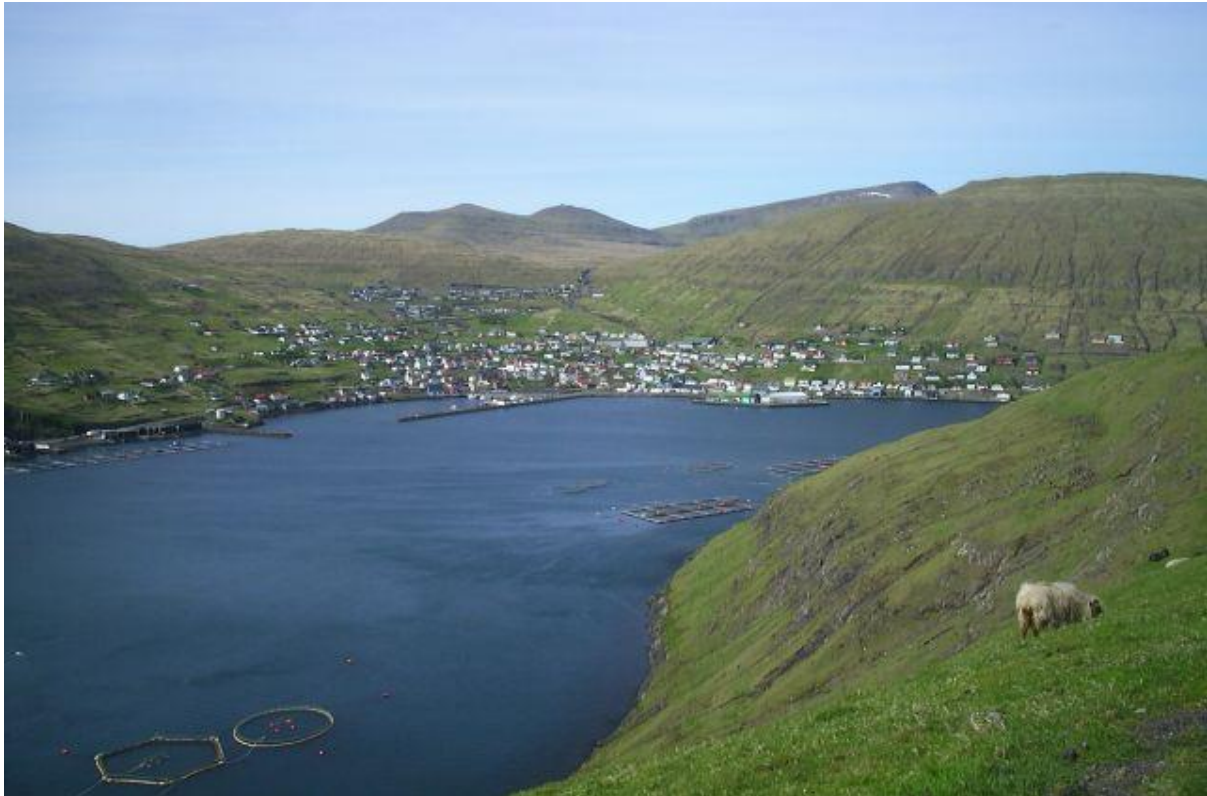
Figure 4 Myndin tikin av Egilsnesi í norðan. Úr bygdini og norðureftir eru fleiri høg fjøll. Har verður luftin tvungin uppum, guvan fer úr – so er skýgerð og avfall, ið røkkur til bygdina. Inni á Fjørð kann vera turt. Fjøllini verja fyri vindinum, og taka eitt sindur av ferðini. Tað sæst, at hann er beinur norðan, tá ið tað er stilli undir Seglhúsinum, sum er inni á Fitjum.

Tá ið tað er norðan, er vindferðin sum heild minni enn miðal fyri landið.