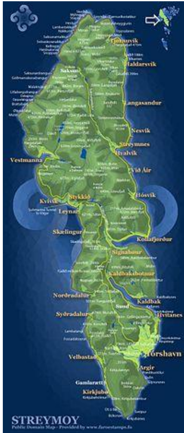
Mynd 1: Kort av Streymoy. Tórshavn er við bygd við sunnara enda – eystaru megin.

Eystan fyrir Nólsoyarfjørð er Nólsoy. Hon forðar briminum á eysturættum, men gevur onga verju, tá ið hugsað er um veðrið.