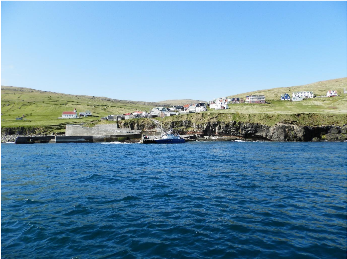
Mynd 9: Ímóti útsynningi vestri.