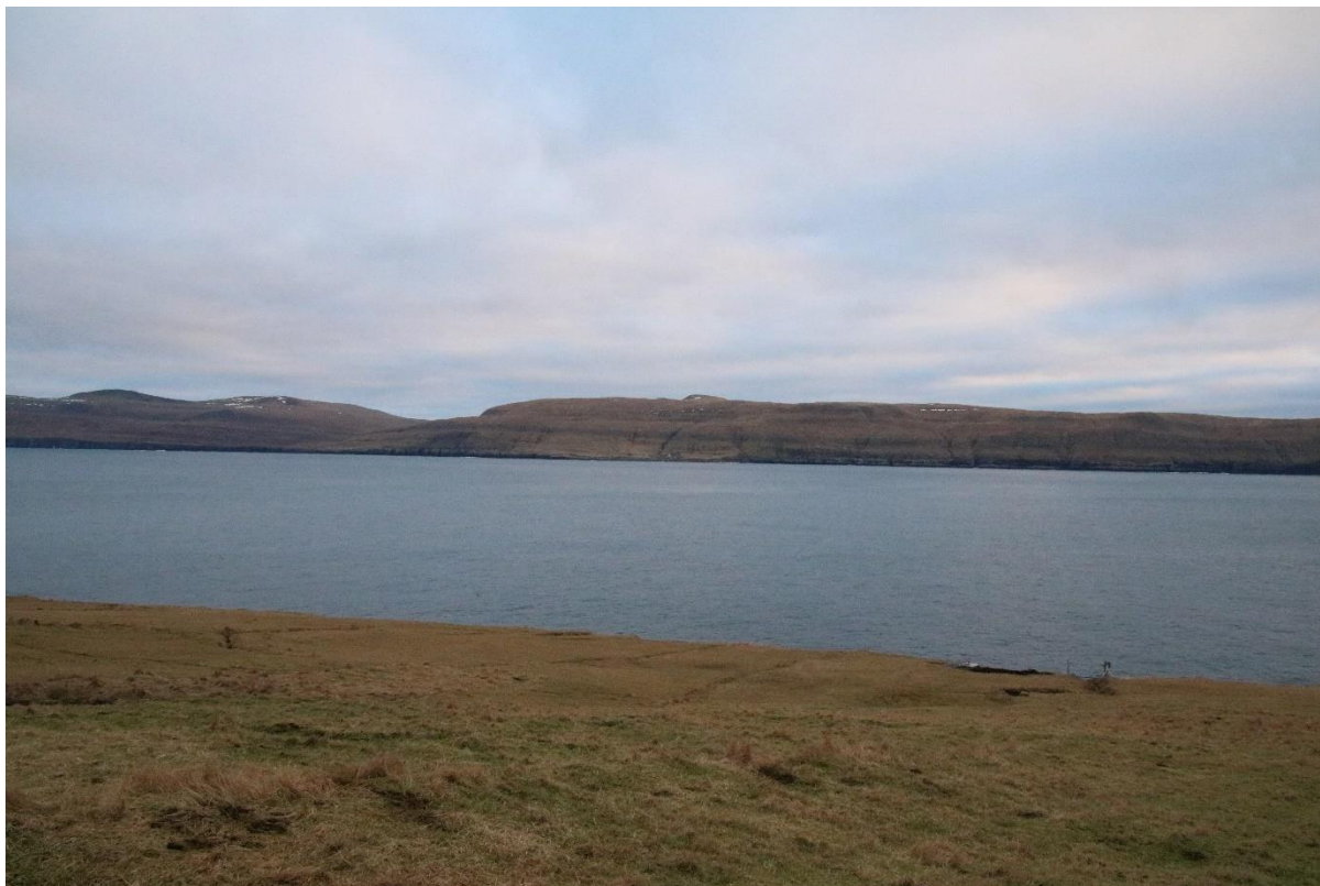
Mynd 3: Ímóti landnyrðingi

Tá ið hann kemur av landnyrðingi, rakar lotið oynna sunnan fyri Skarvatanga, verður lyft slakar 100 metrar, áðrenn tað kemur til bygdina. Tá ið landnyrðingurin kom, vóru sum byrsuskot at hoyra inni undir landi á Sandoyggi.