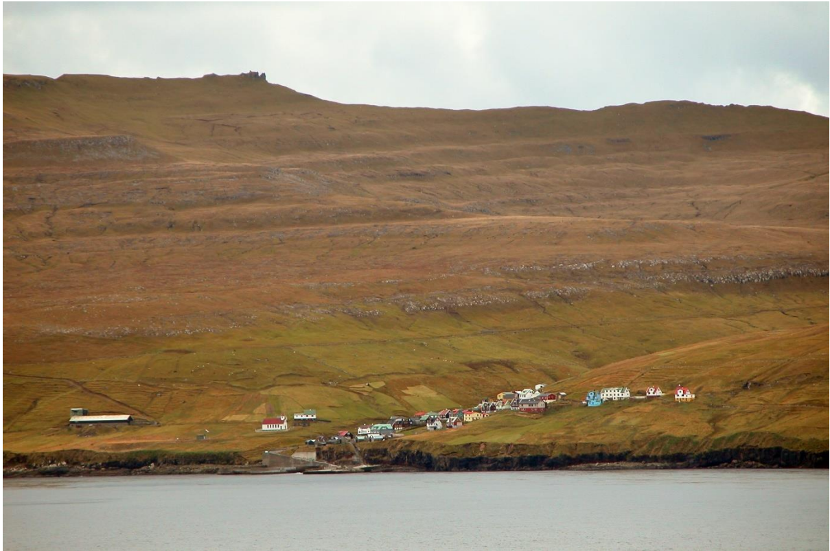
Mynd 8: Myndin tikin av bygdini í útsynning.

Útsynningur er ringasta ættin í bygdini til vind.