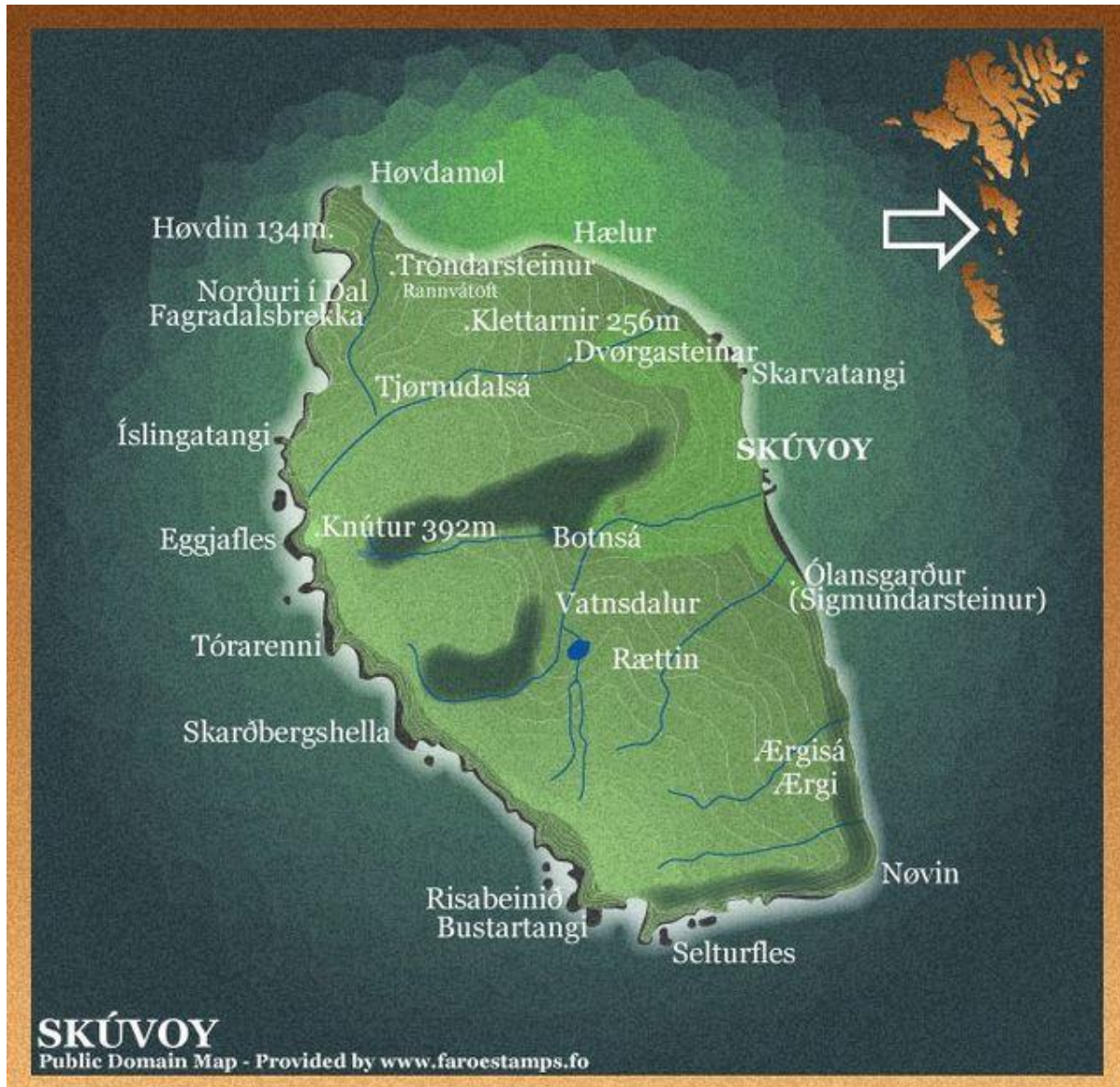
Mynd 1: Kort av Skúvoy.

Byggin er miðskeiðis á eystursíðuni á oynni. Úr byggin og vestureftir er oyggin hægri. Hægsta fjallið er Knútur (392m). Vestari partur av oynni er javnt høgur.