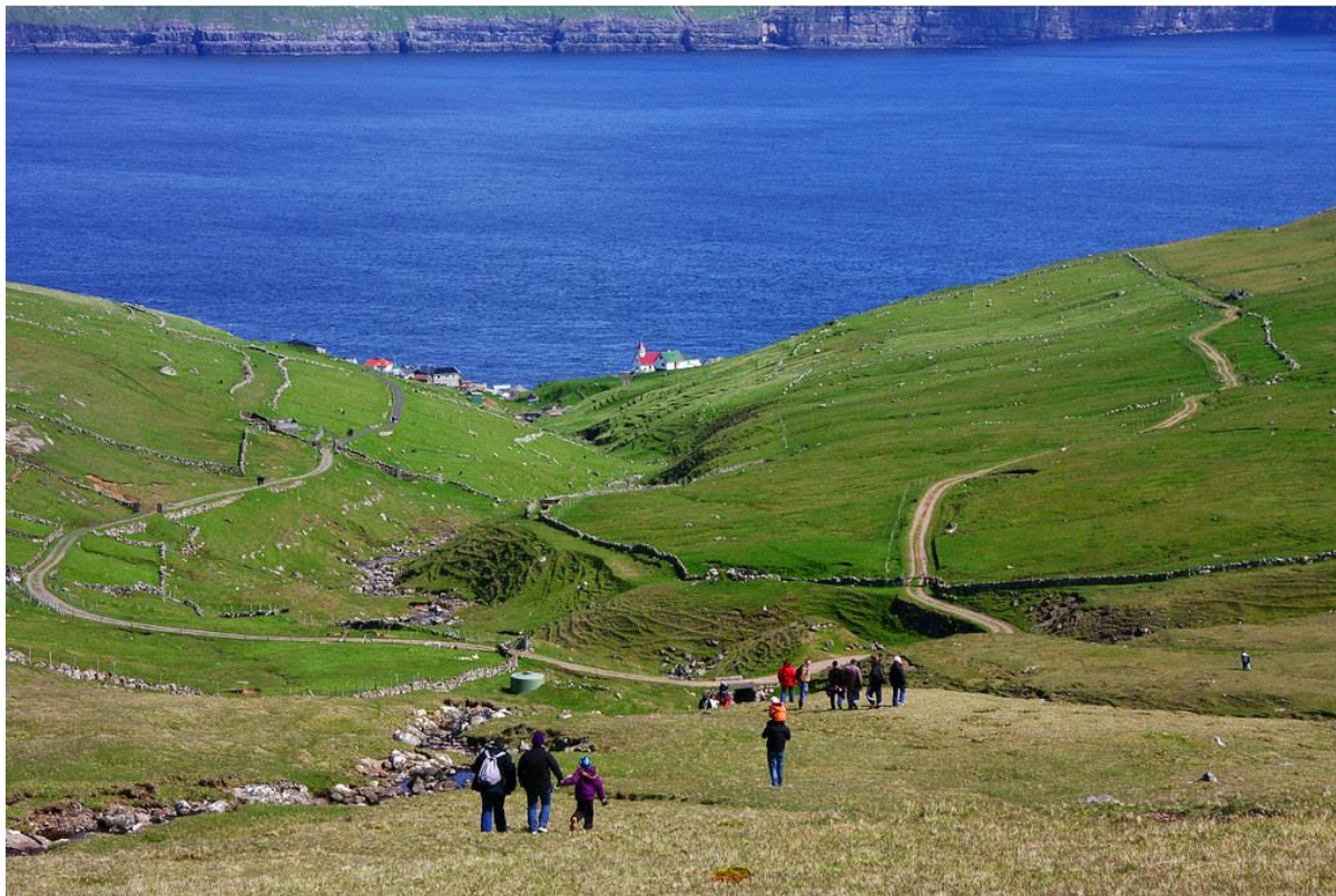
Mynd 4: Ímóti eystri

Tá ið hann liggur av eystri, kemur lotið av Sandoyinni og beint inn ímóti bygdini.