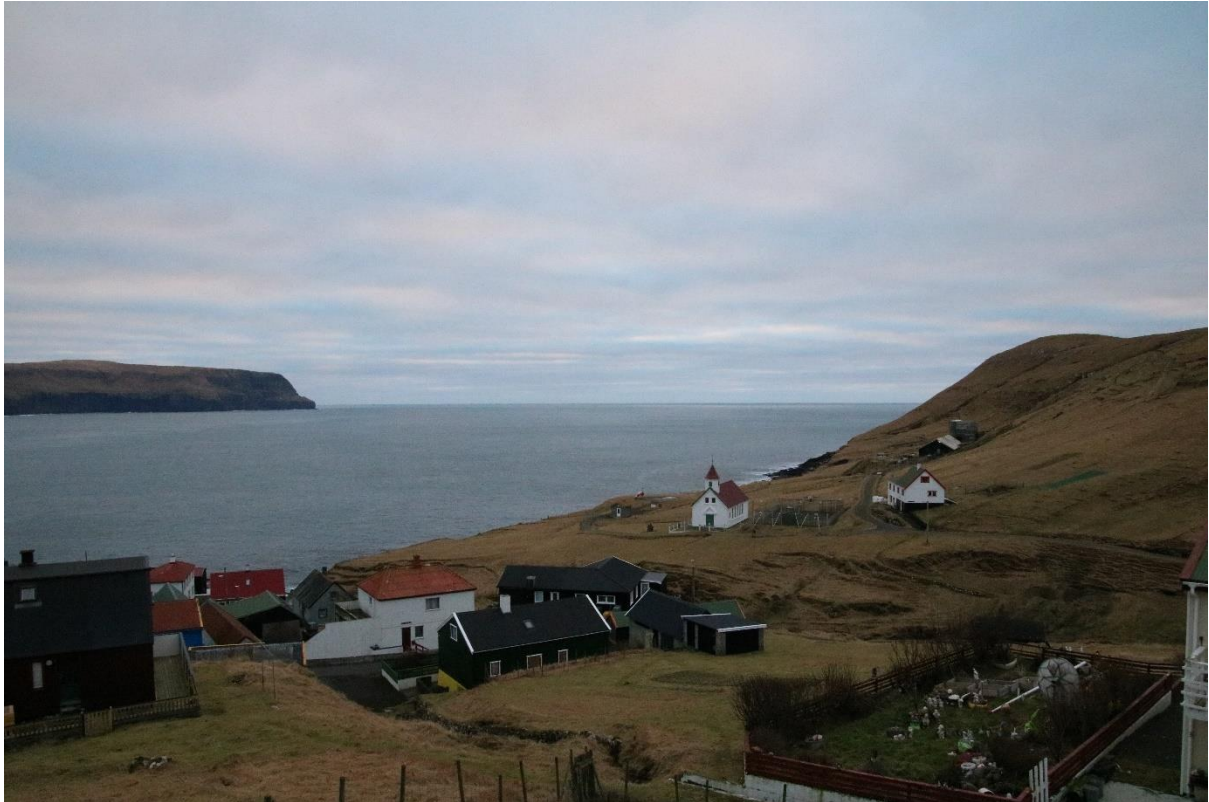
Mynd 5: Myndin tikin móti landsynningi. Lotið er leyst av Dalsendanum og kemur beint úr fjørðinum til bygdina.

Tá ið ættin er landsynningur, kemur lotið beint úr fjørðinum til bygdina.