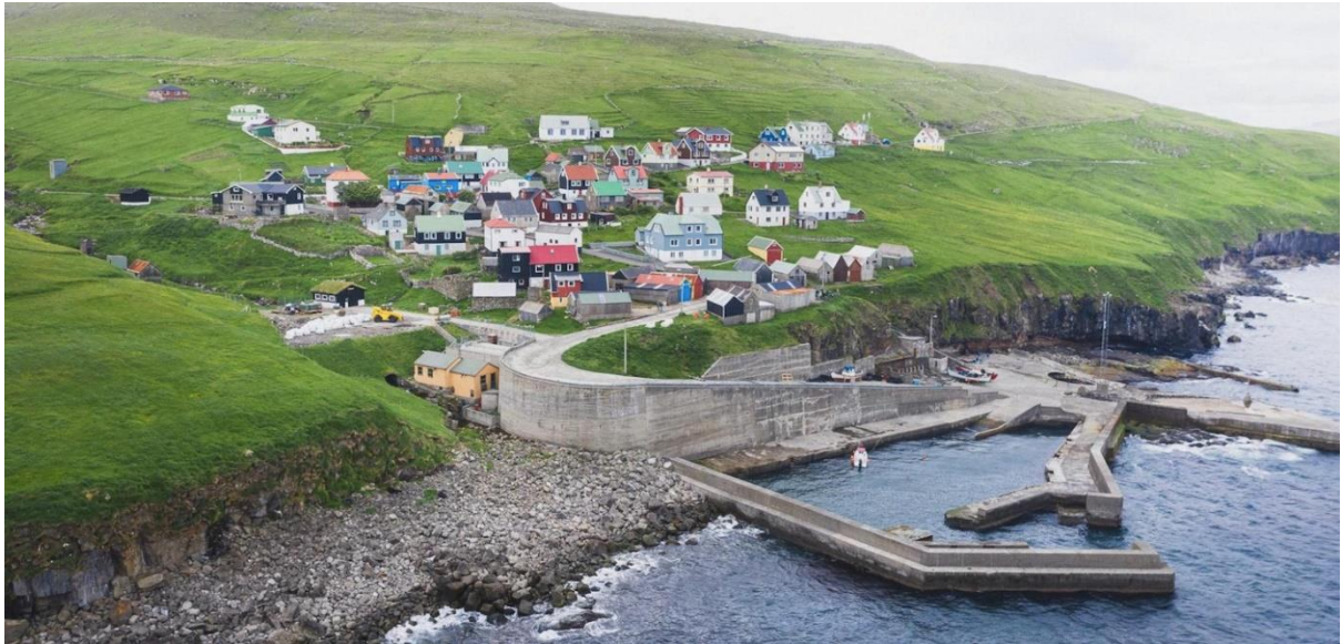
Mynd 11: Ímóti útnyrðingi

Á útnyrðingi er vindur í bygdini javnur. Vindurin merkist ikki væl.