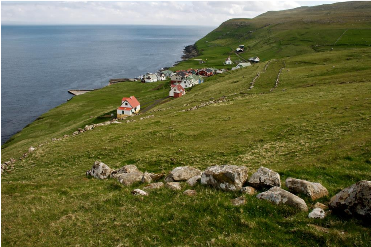
Mynd 6: Skúvoyarbygd ímóti landsynningi suðuri.