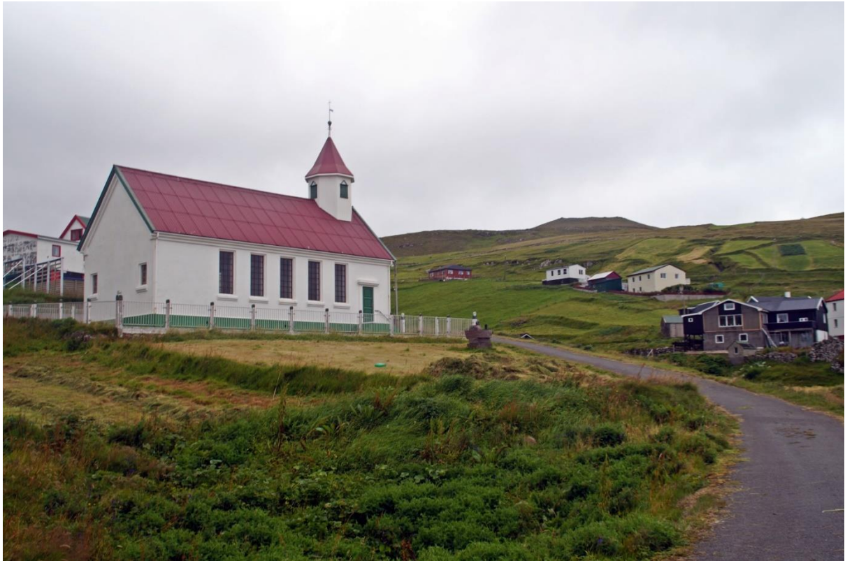
Mynd 10: Ímóti vestri

Tá ið ættin er vestan fyrri útsynning, er vindurin javnur. Tað kann vera meiri vindur í ættini oman ígjøgnum bygdina.