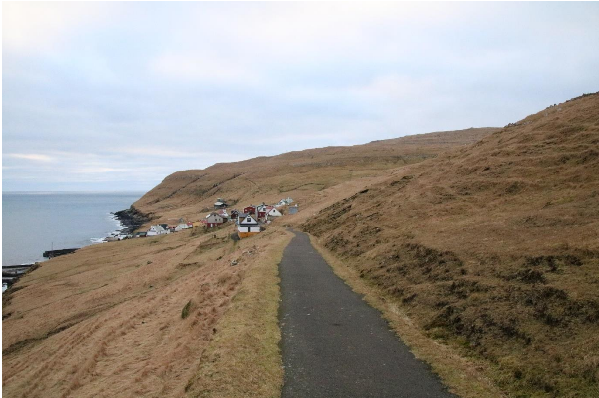
Mynd 7: Ímóti suðuri

Á suðuri er vindurinn javnur. Í bygdinni er sami vindur sum í landinum, tó kann nógvur vindur vera niðast í bygdinni. Suðurættin kann uppføra seg ymiskt. Er hann á veg ímóti útsynningi, kann tað verða skaðaætt. Liggjandi suðurætt er ikki skaðaætt.